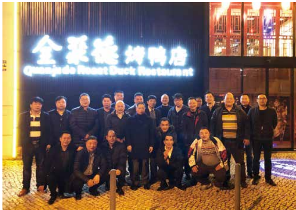
△ 2017年弟兄团契在全聚德餐馆门口合影