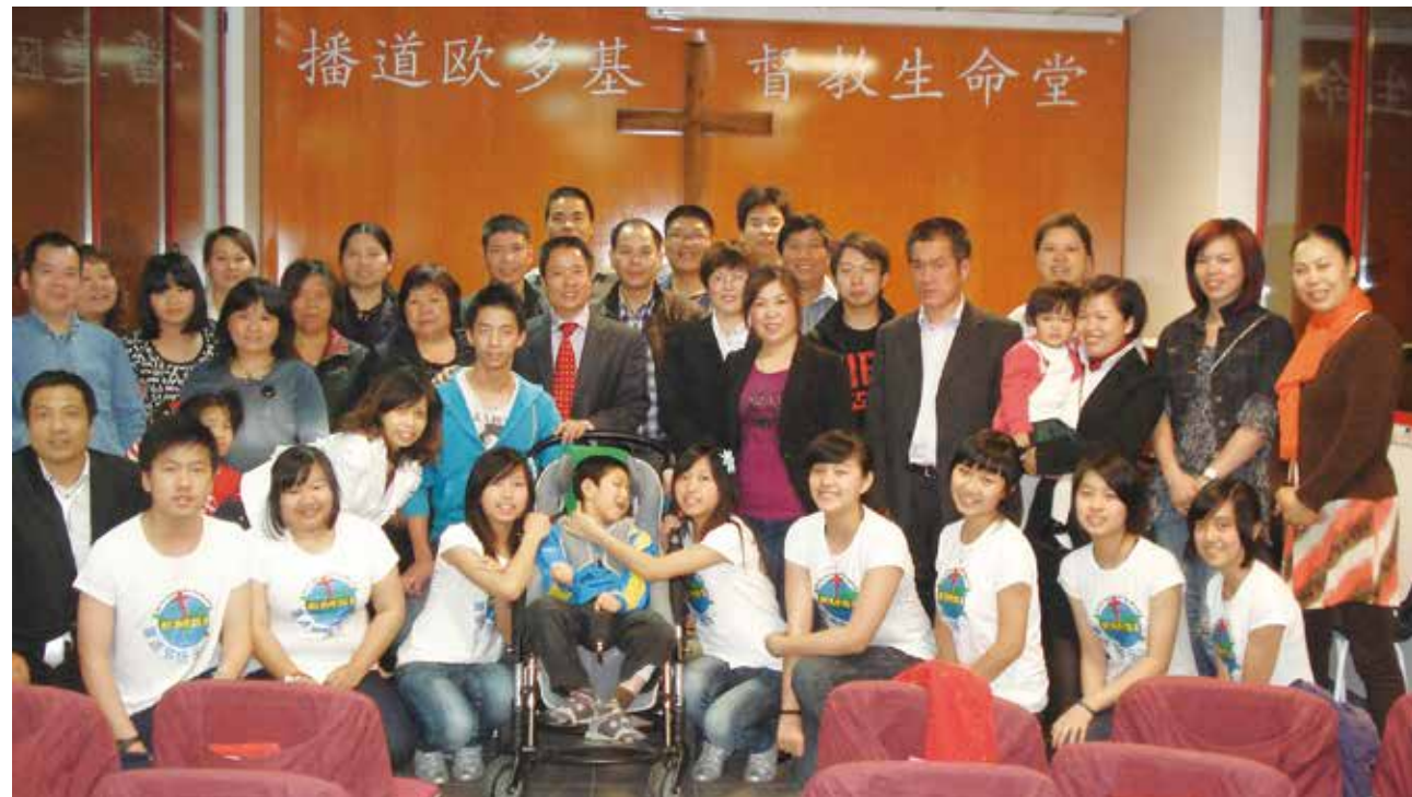
▽ 2011年播道欧多生命堂一周年庆