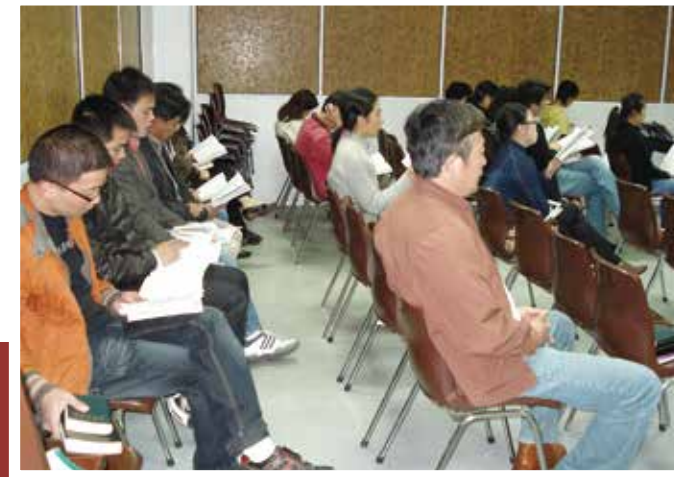
△ 明德路生命堂最原始的聚會