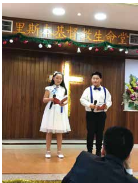
△ 教會最年輕的主持人