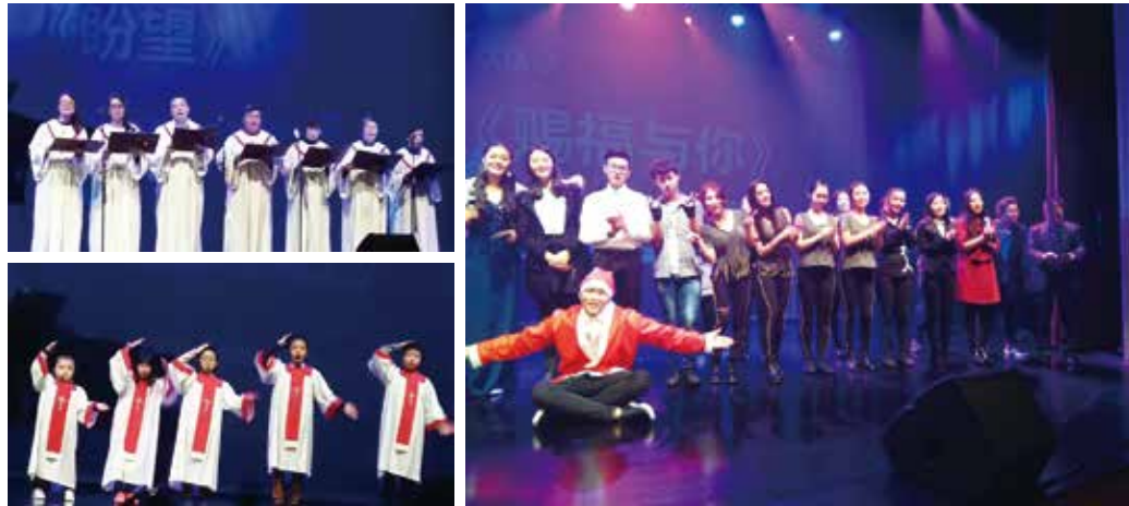
2016年12月 亞速爾聖誕 晚會詩班