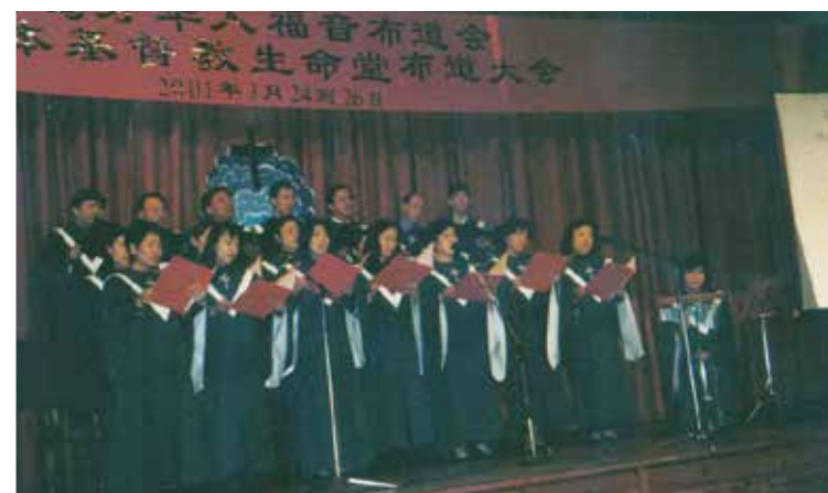
△ 2001年3月24-26日葡萄牙福音佈道會音樂佈道會美國神學院神學生獻詩