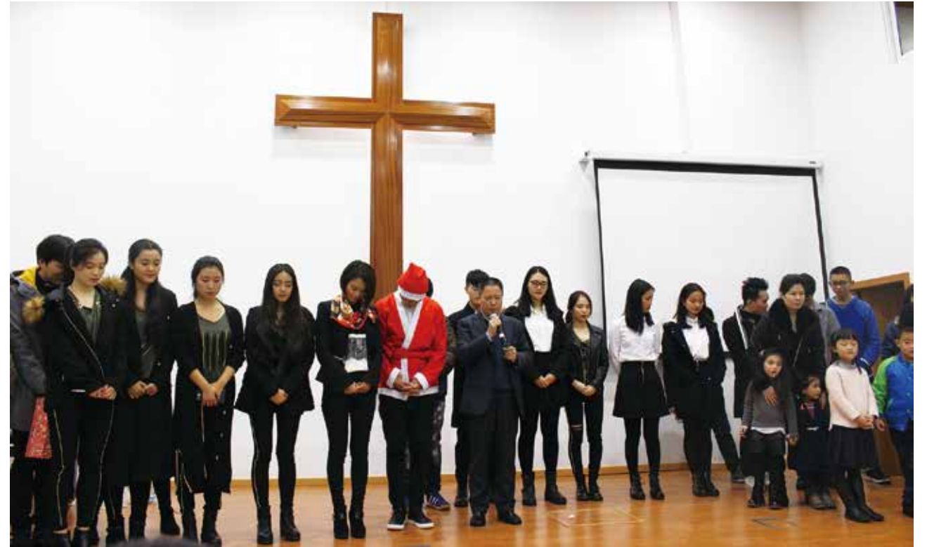
△ 2013年明德路圣诞晚会