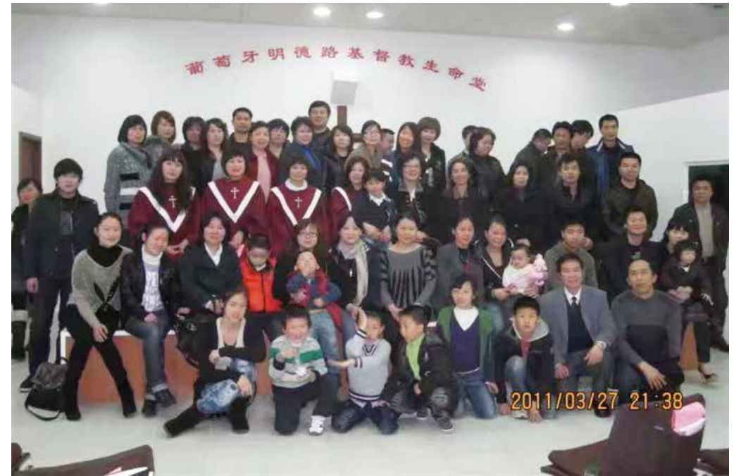
△ 2011年明德路復活節合影