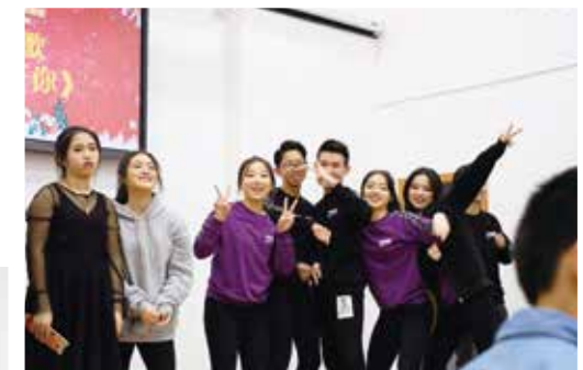
△ 2018年聖誕晚會少年團契