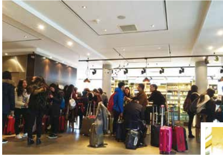
△ 葡萄牙生命堂青年團契前往荷蘭