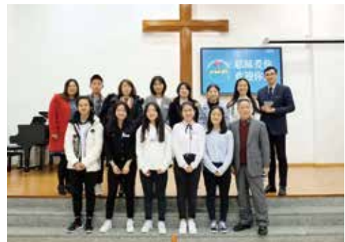
△ 2019年2月10日明德路生命堂受洗合影