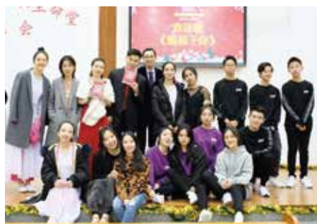
△ 2018年聖誕晚會部分演員