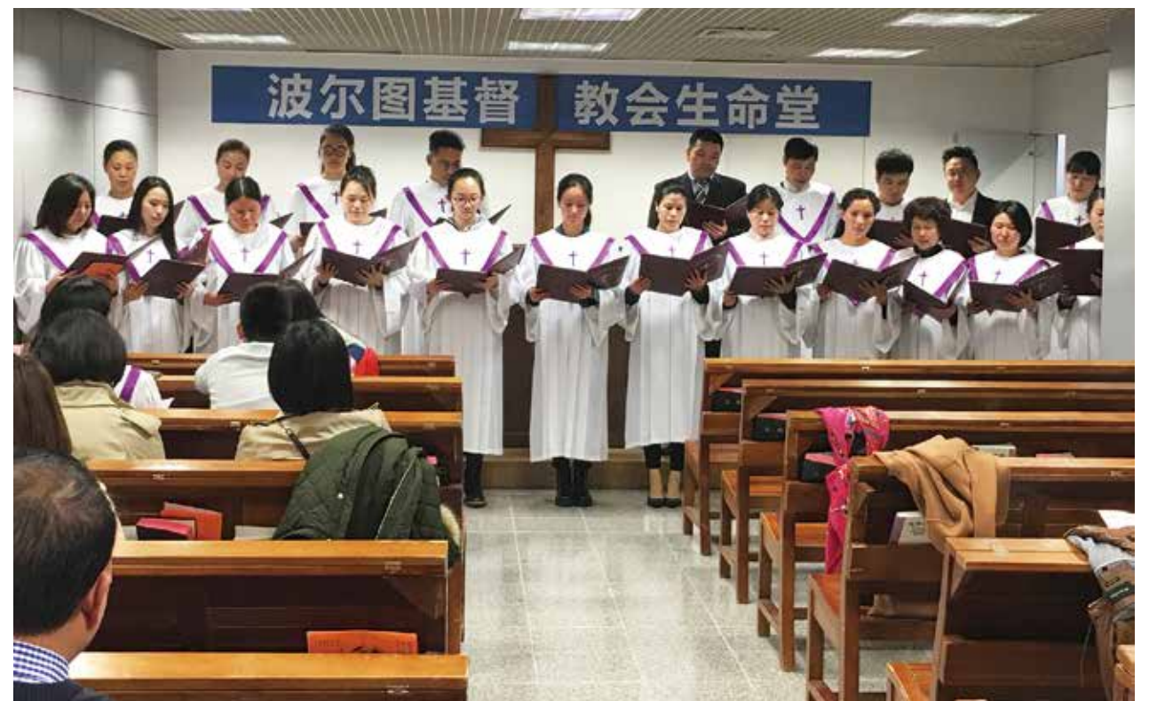
△ 2017年4月11日波尔图落成典礼诗班