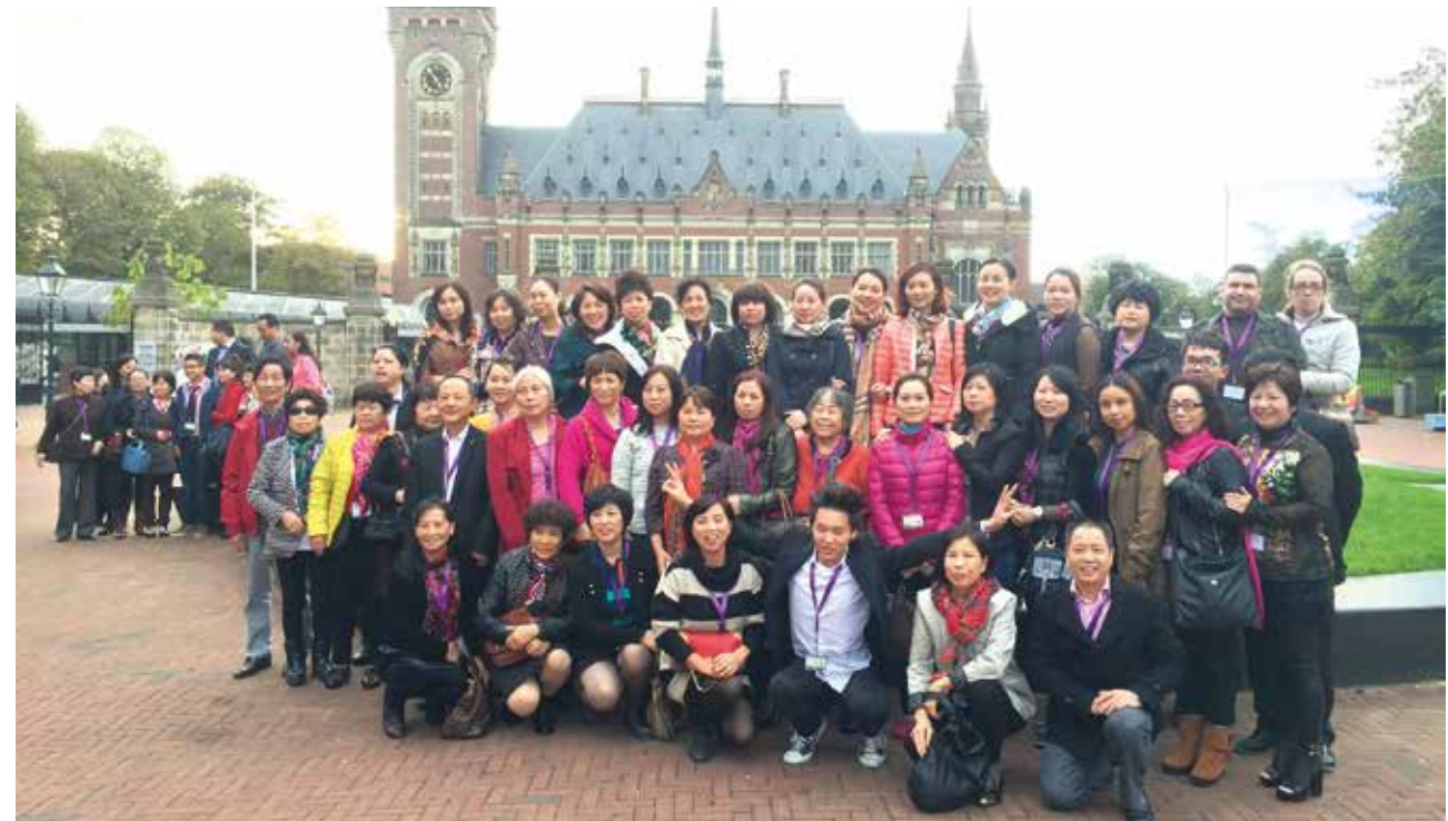
△ 2014年参观荷兰国际法庭