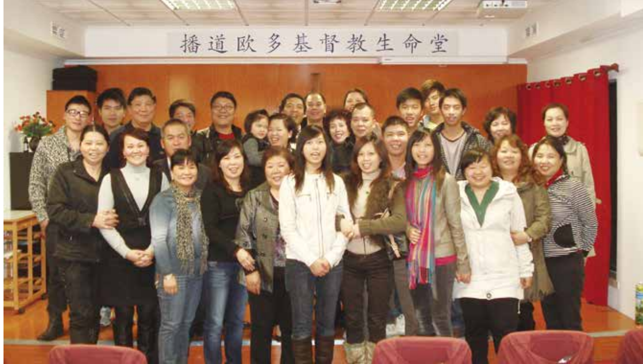
▽ 播道歐多某主日合影