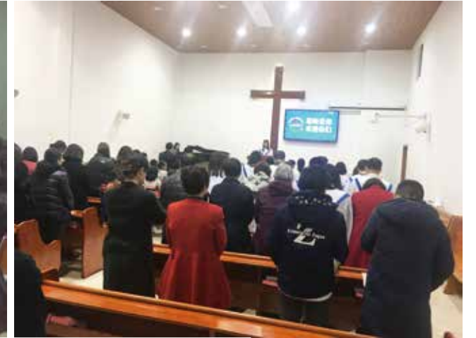
△ 明德路生命堂平時崇拜現場