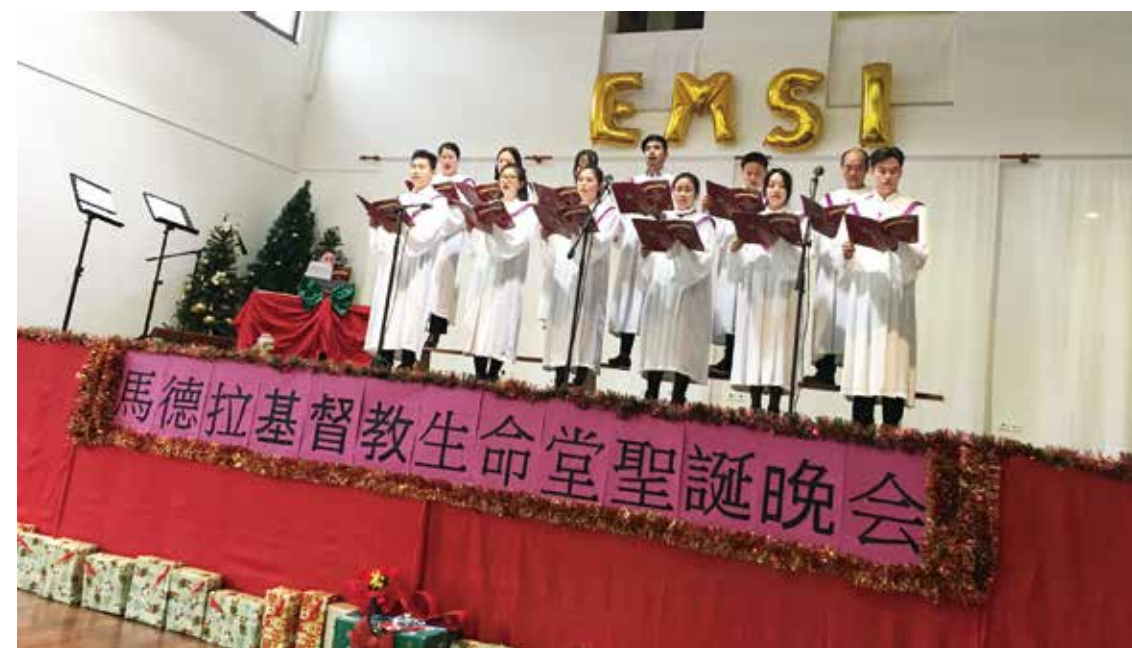
▽ 2017年馬德拉生命堂聖誕晚會詩班獻詩