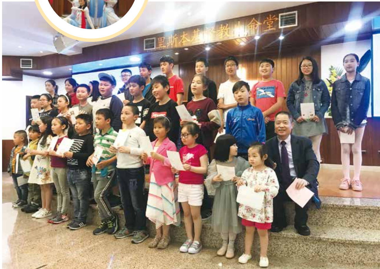
△ 主日学儿童母亲节献歌“世上只有妈妈好”