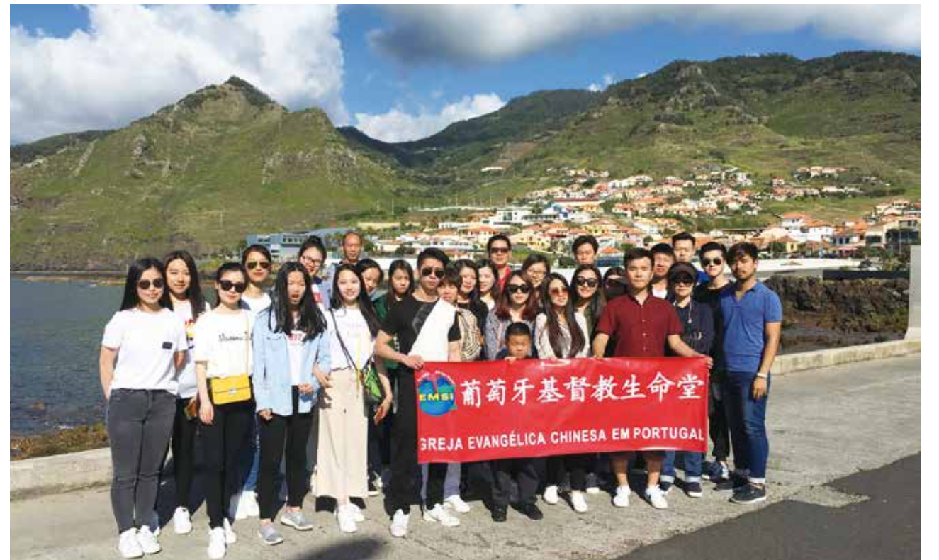
△ 陈牧师带来青年团契马德拉短宣