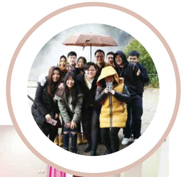
▷ 青年团契户外活动