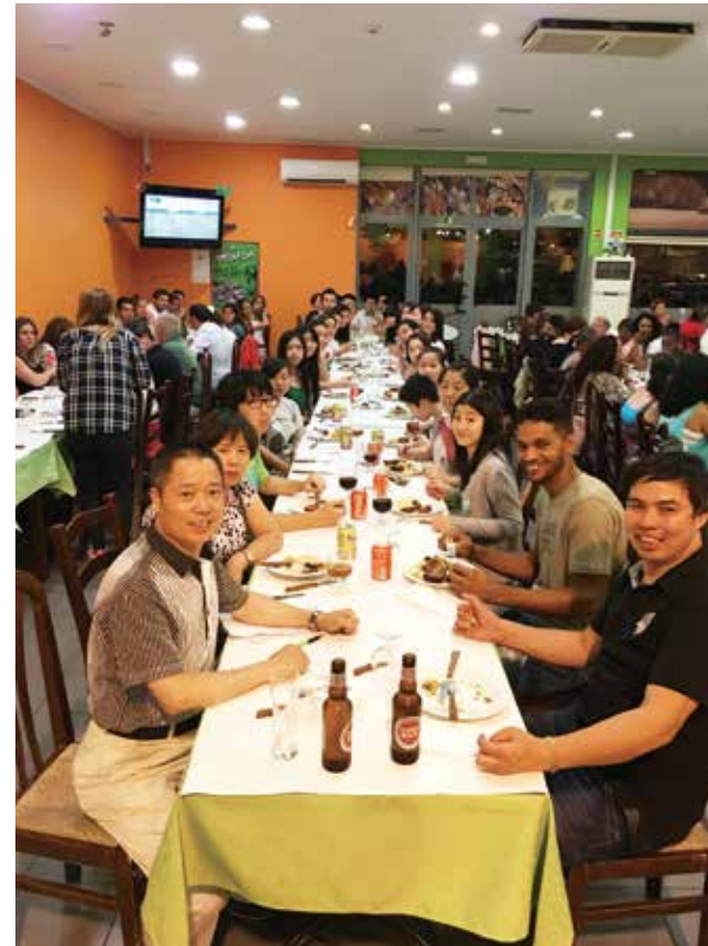
△ 思督堡落成典礼聚餐