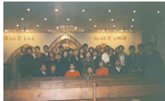
△ 1999年12月5日教堂租到RATO葡國教堂聚會