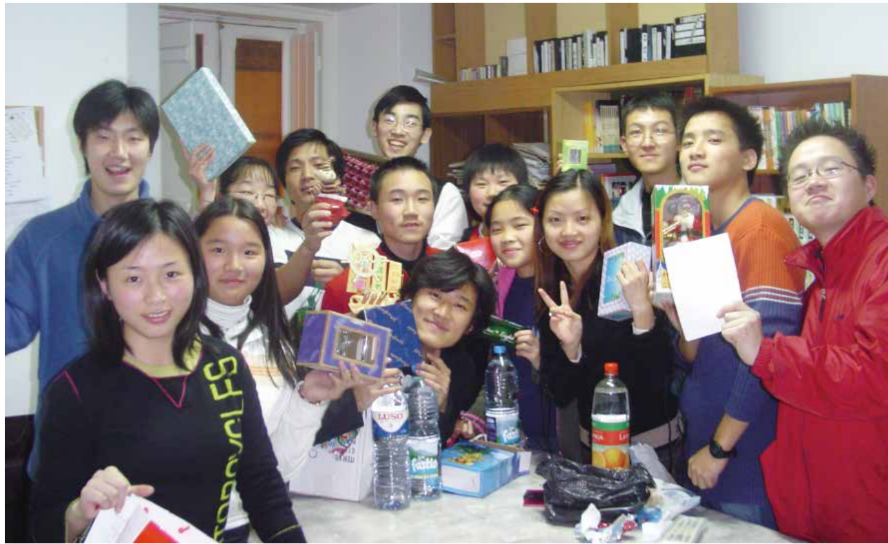
△ 里斯本青少年团契