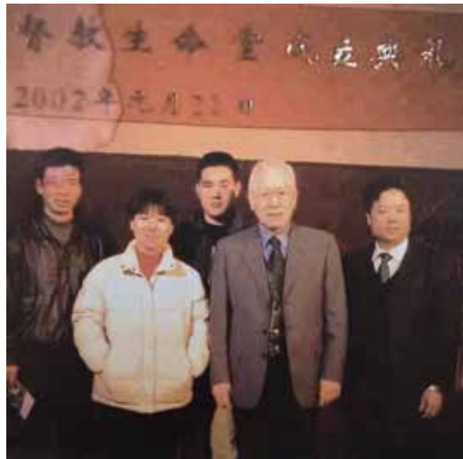
△ 波尔图成立时三位重要见证与牧师合影