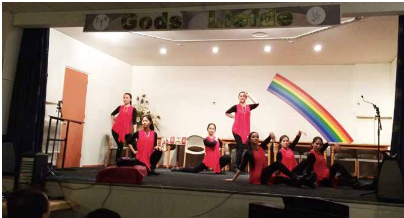
△ 青年團契赴荷蘭演出