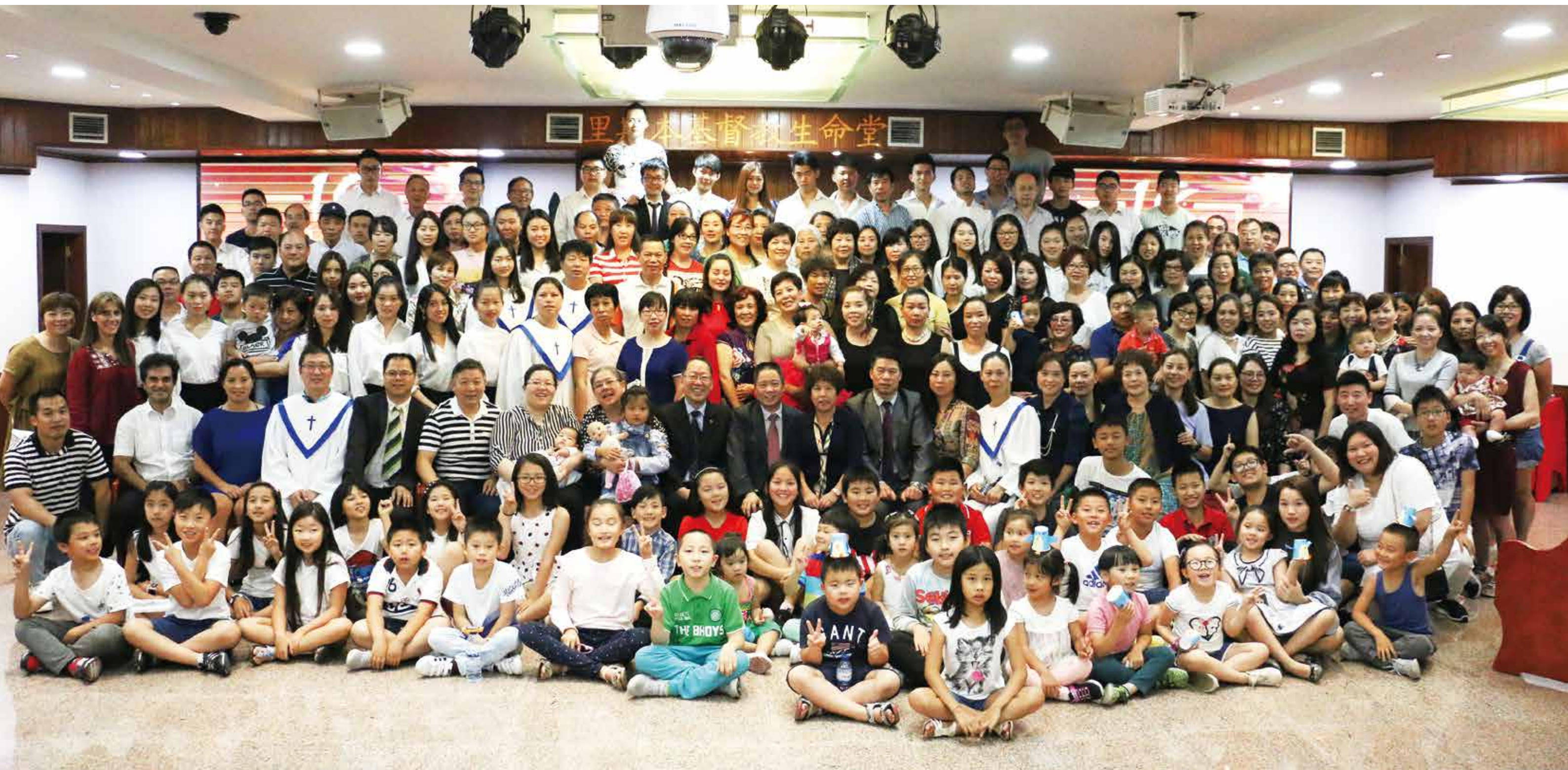
△ 里斯本18周年集体照