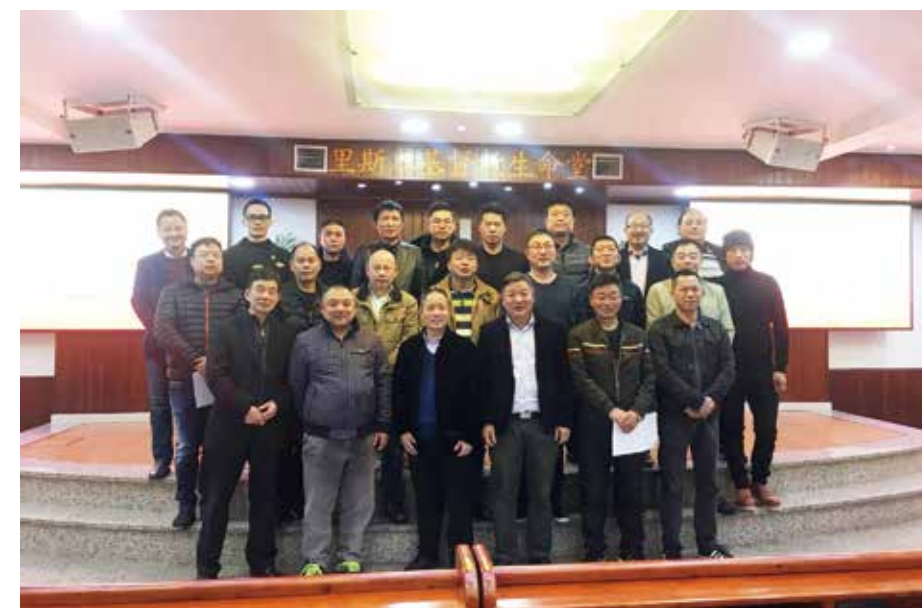
△ 2019年2月份弟兄团契愿为耶稣的缘故改变自己