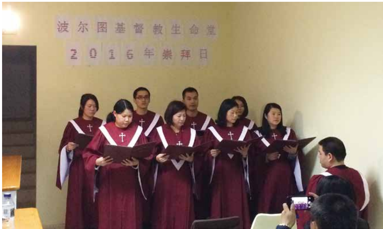
△ 2016年波尔图生命堂迁移到RUA DE OLIVEIRA MONTEIRO聚会