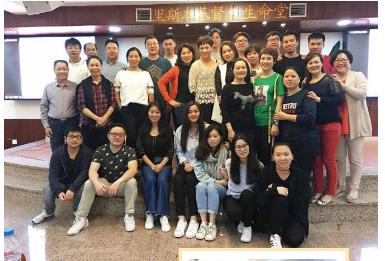
△ 每周礼拜六参加诗班和祷告会的忠心会友