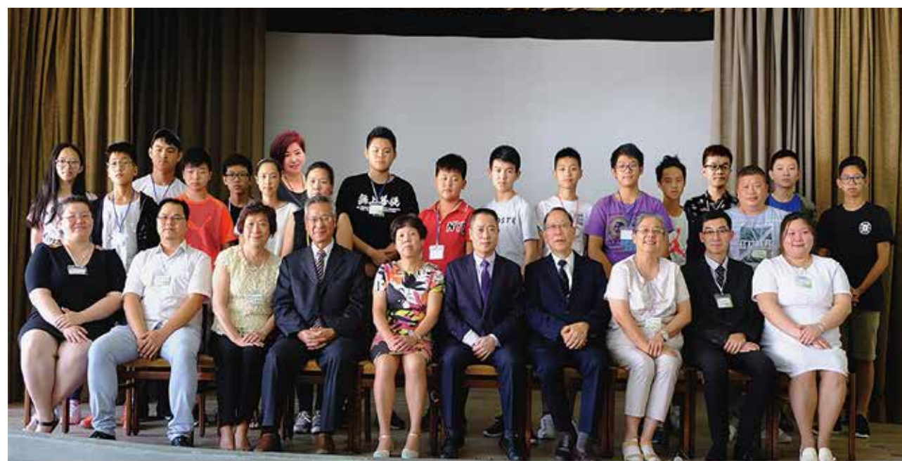
△ 2018年夏令营有感动将来一生事奉神的弟兄姐妹与牧者合影