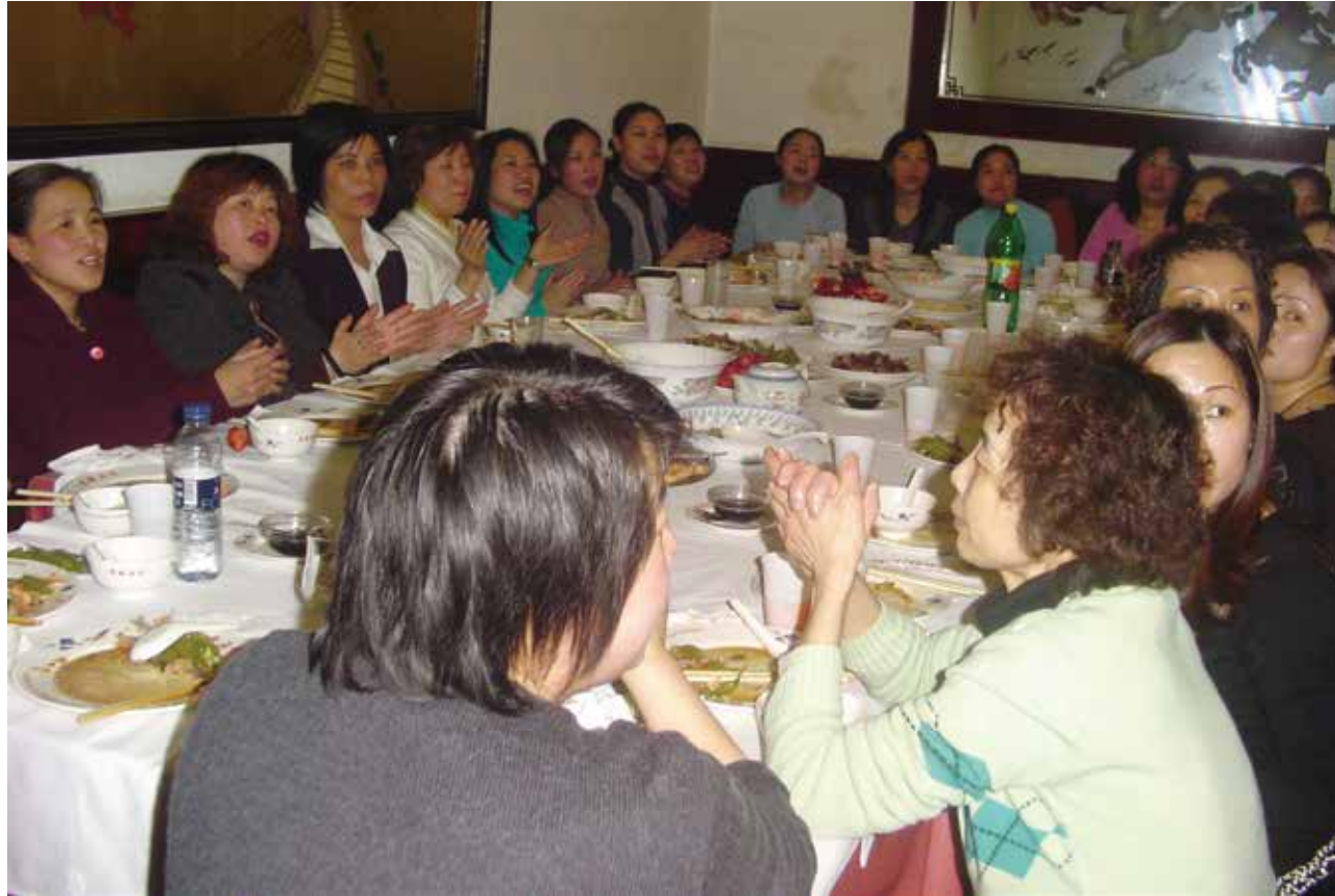
△ 姐妹團契在宏發聚餐