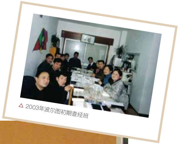
△ 2003年波尔图初期查经班