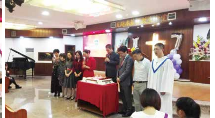
△ 里斯本17周年佈道會同工為教會發展同心禱告