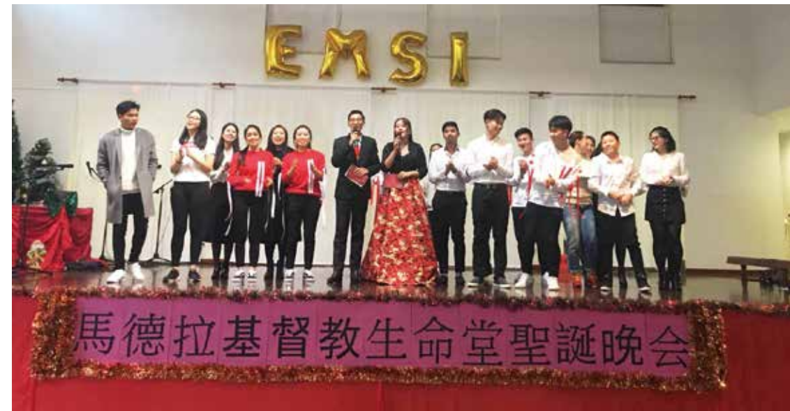
▽ 2017年馬德拉生命堂聖誕晚會全體演員