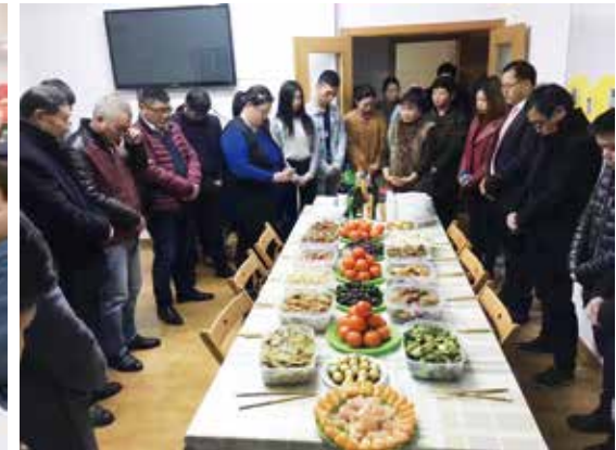
△ 周年庆会前在教堂聚餐