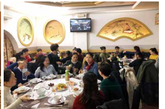
△ 重庆火锅店姐妹团契