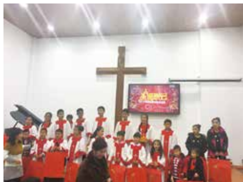
△ 2017年演出結束分禮物