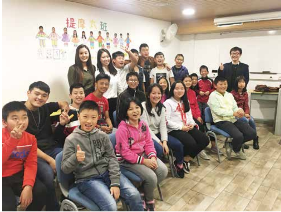
△ 里斯本主日學提摩太班