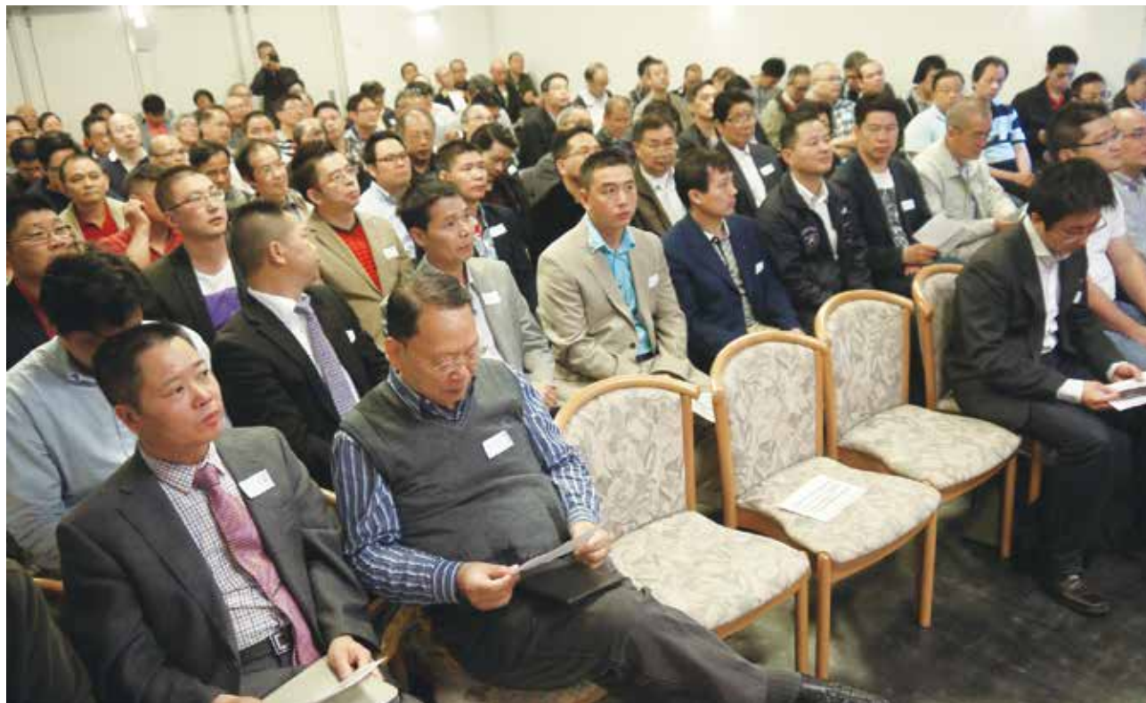
△ 与荷兰弟兄部联合聚会