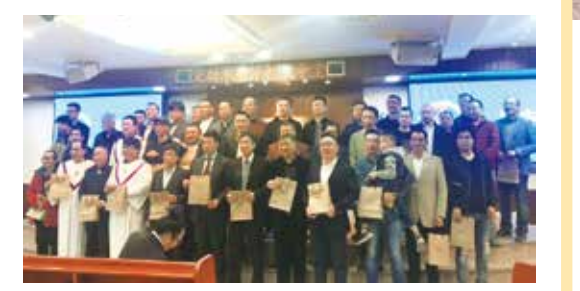
△ 2019年3月17日里斯本父亲节