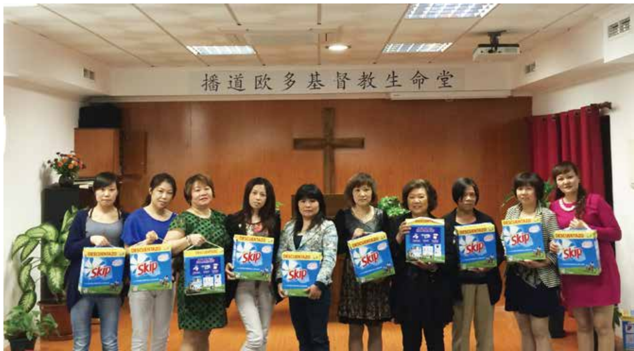
△ 播道歐多姐妹團契