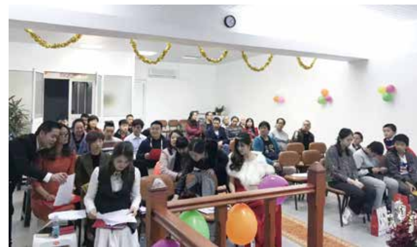
△ 2017年亞速爾聖誕晚會