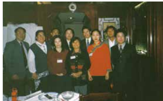
△ 1999年11月14日里斯本第一屆同工就職禮