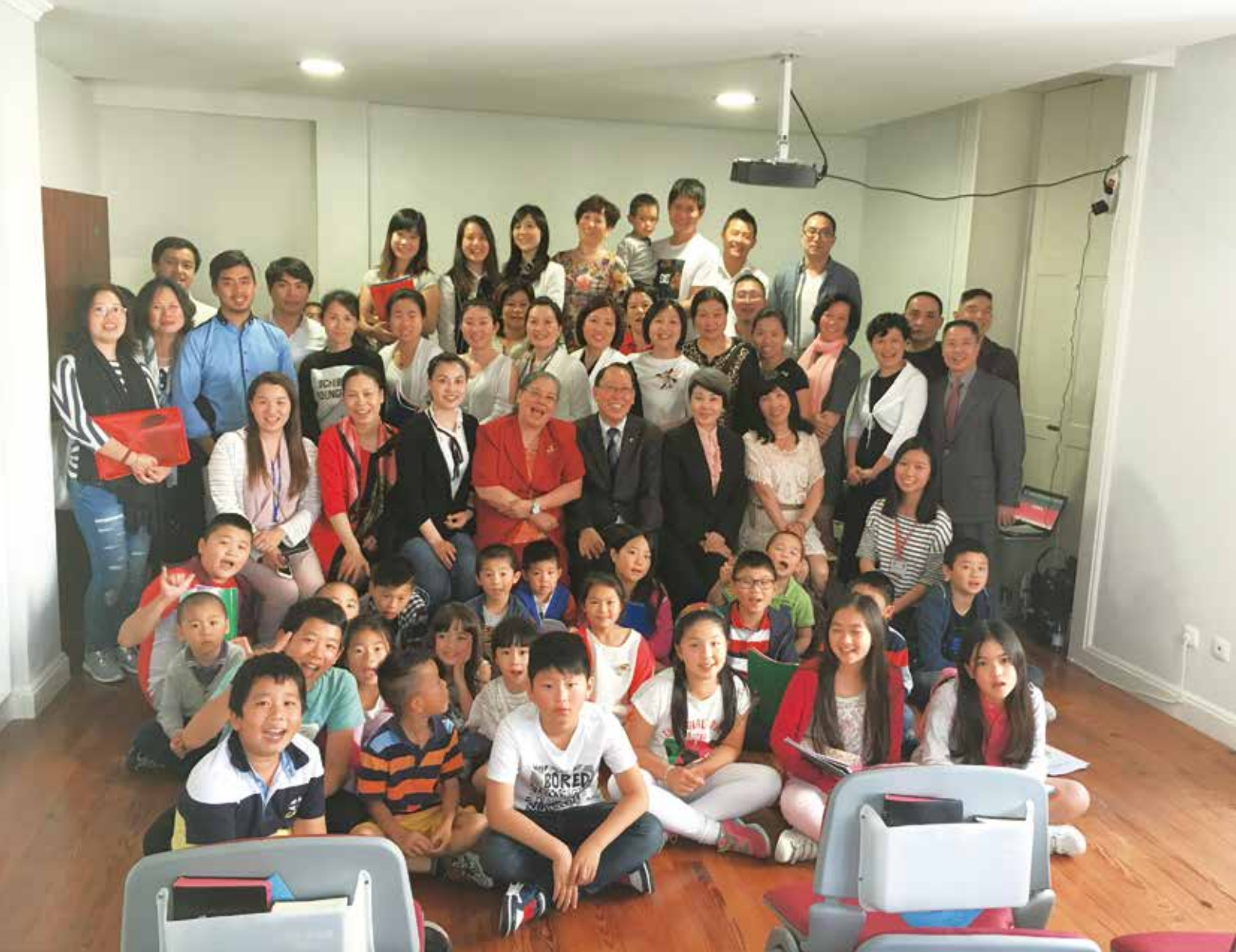
△ 2016年马德拉生命堂成立合影