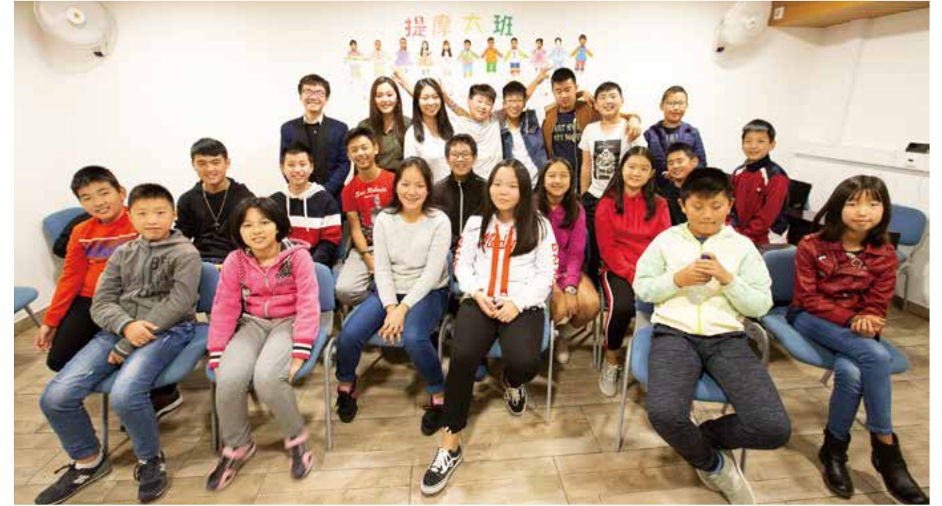
△ 里斯本主日學提摩太班