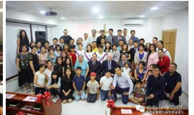
△ 思督堡成立暨落成典礼