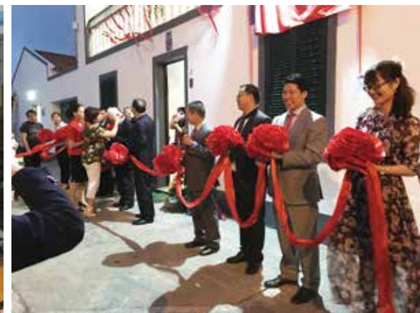
△ 2016年8月亞速爾落成典禮