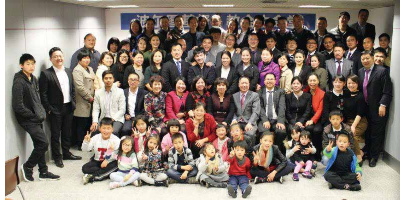
△ 2017年4月11日波尔图生命堂落成典礼合影