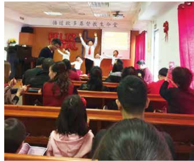
△ 播道歐多聖誕晚會