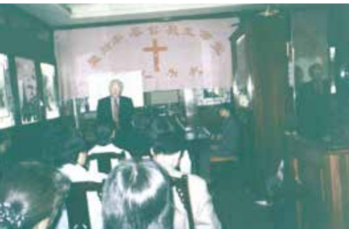
△ 1999年10月21日里斯本基督教生命堂在宏發餐館成立典禮