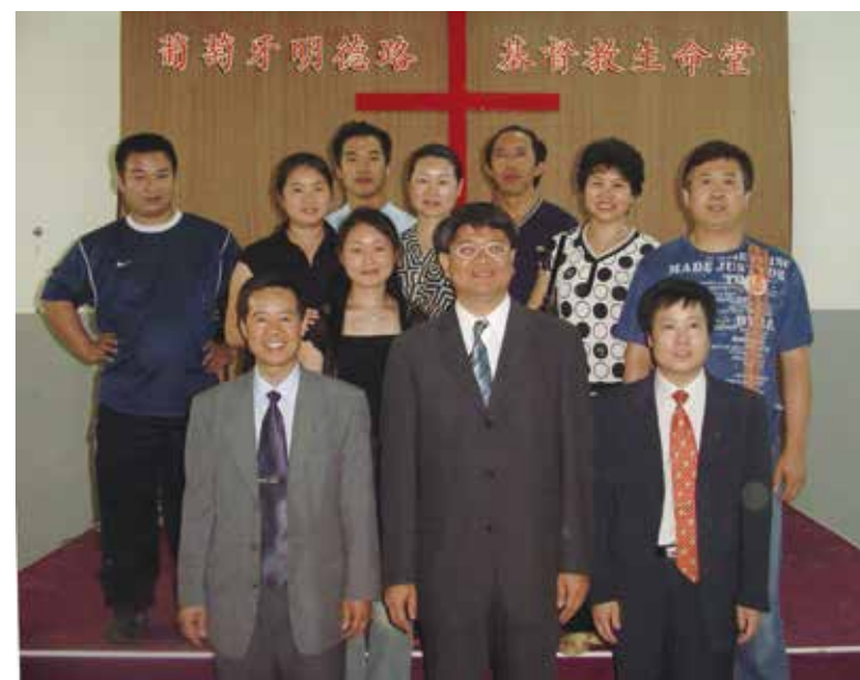
△ 2006年6月11日明德路生命堂牧者与部分同工合影