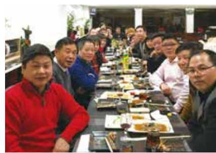
△ 播道欧多弟兄团契