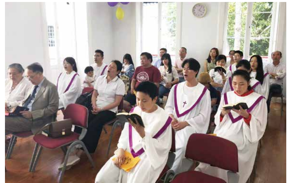
△ 马德拉平时聚会现场