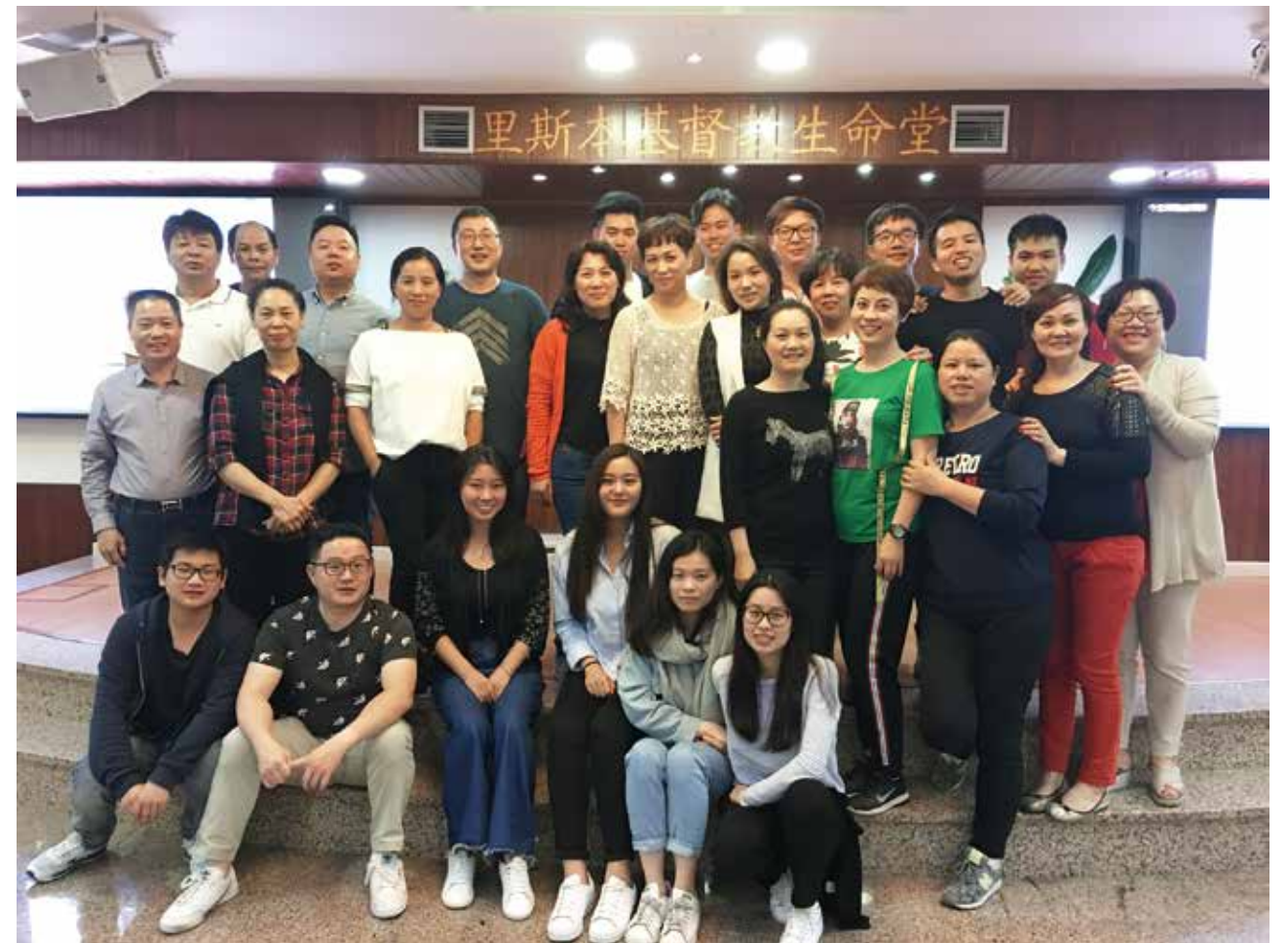
▽ 2018年10月11日祷告会合影