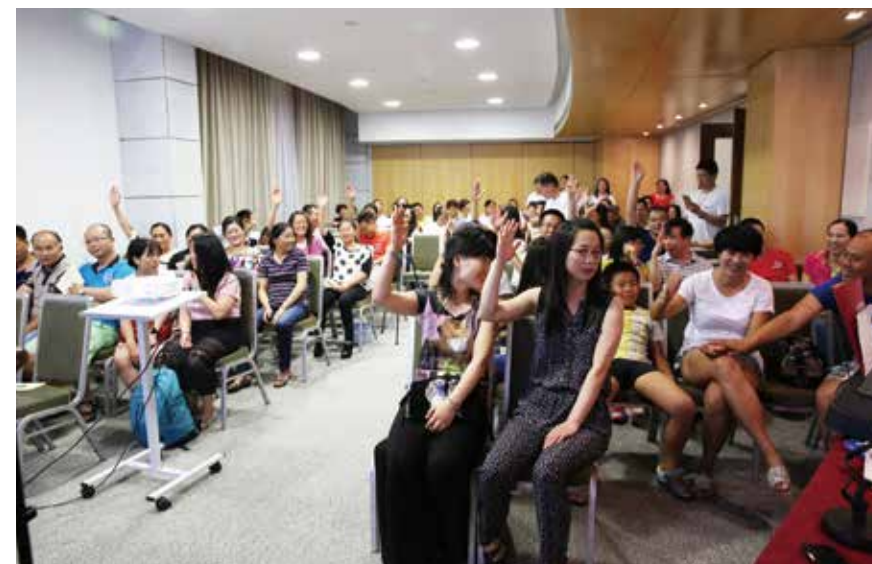
△ 2015年7月15日亚速尔音乐佈道会现场反应活跃