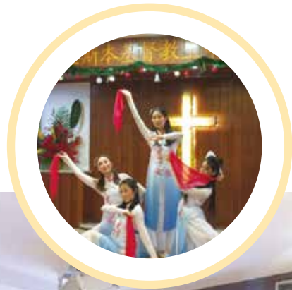
△ 圣诞节青年女生舞蹈