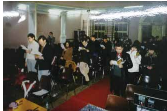
▽ 2002年波尔图成立后在Rua de José Falcão聚会