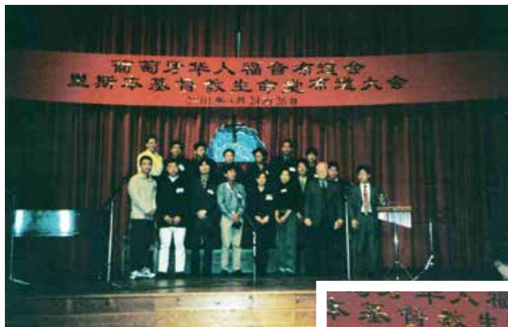
△ 2001年3月音樂佈道會受洗人員合影