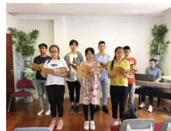
△ 2018年马德拉生命堂青年献诗