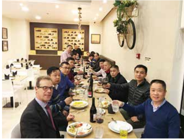
△ 2017年弟兄团契在永栋餐馆聚餐