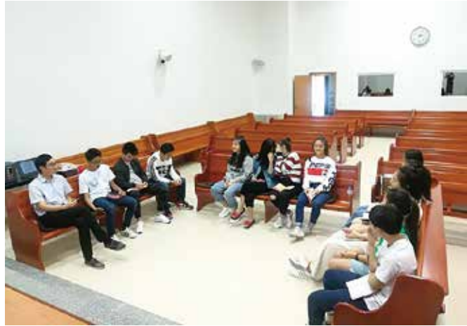
△ 2018年明德路青年團契