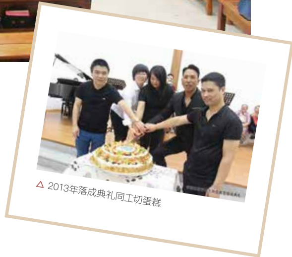
△ 2013年落成典礼同工切蛋糕