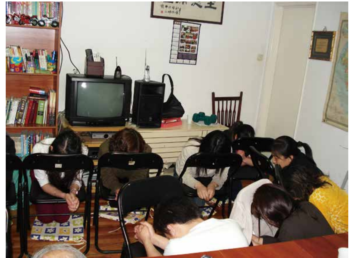
▽ 2003年里斯本在貨行禱告會