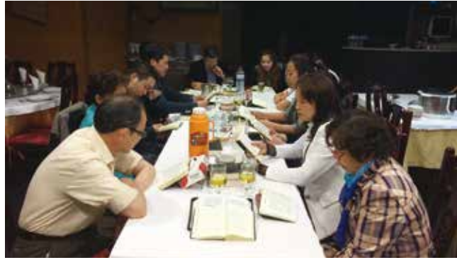
△ 周四晚12点好日子餐馆查经