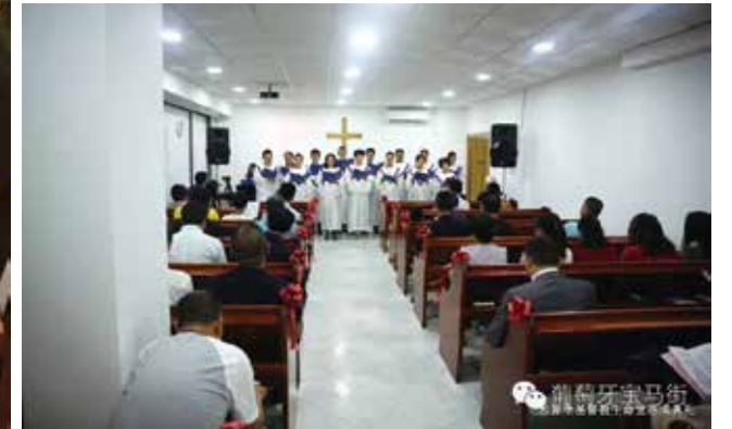
△ 思督堡落成典礼诗班