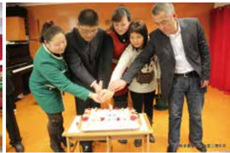
△ 三周年同工切生日蛋糕