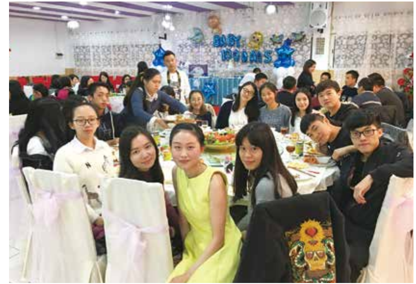
△ 明德路春节感恩聚会