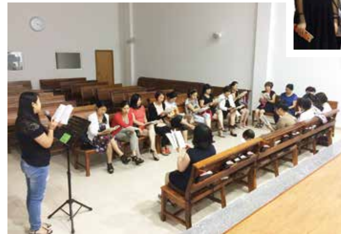
△ 2018年明德路姐妹團契