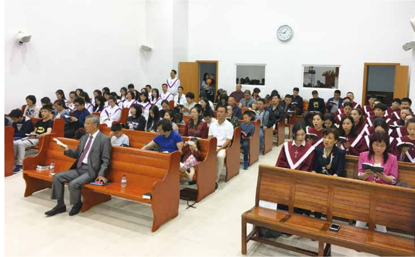
△ 2018年明德路周年聚會