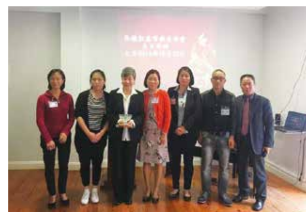
△ 2016年10月23日马德拉受洗合影