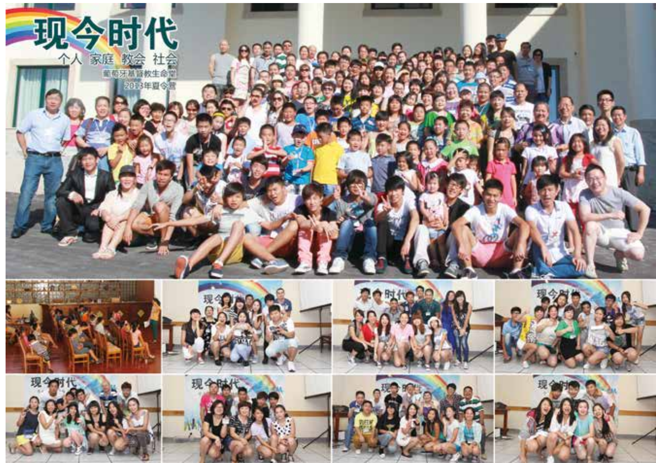
△ 2013年葡萄牙生命堂夏令营