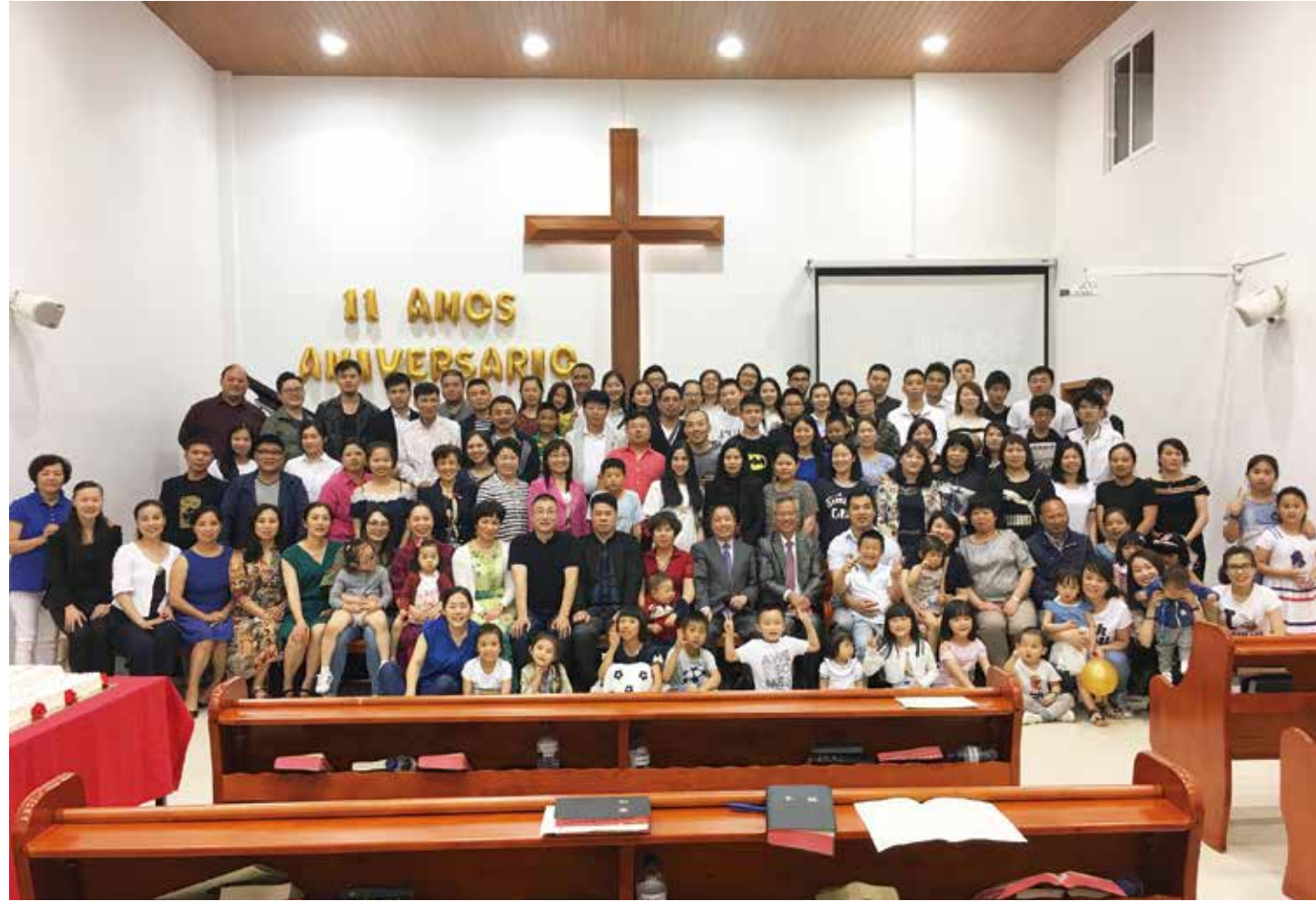
▽ 2018年明德路11周年集体照