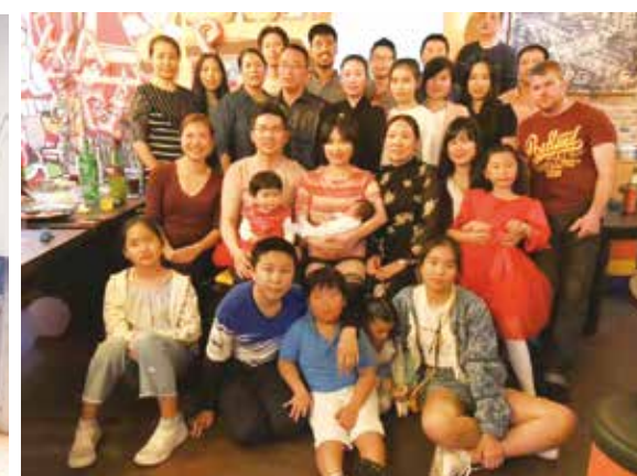
△ 马德拉生命部分弟兄姐妹合影