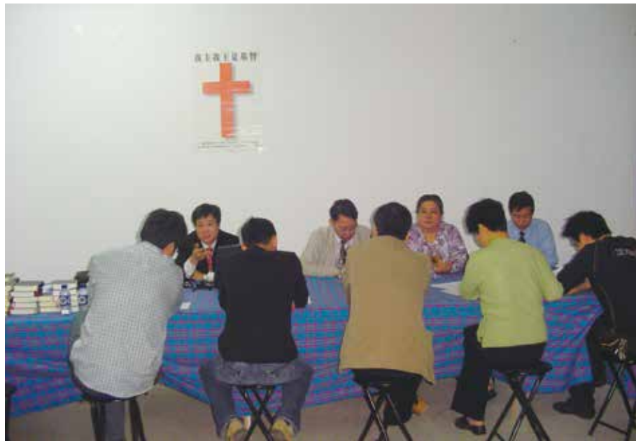
△ 2002年第一届同工开会