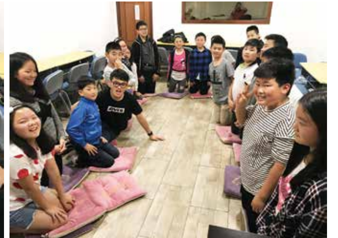
▽ 里斯本主日学绘画课