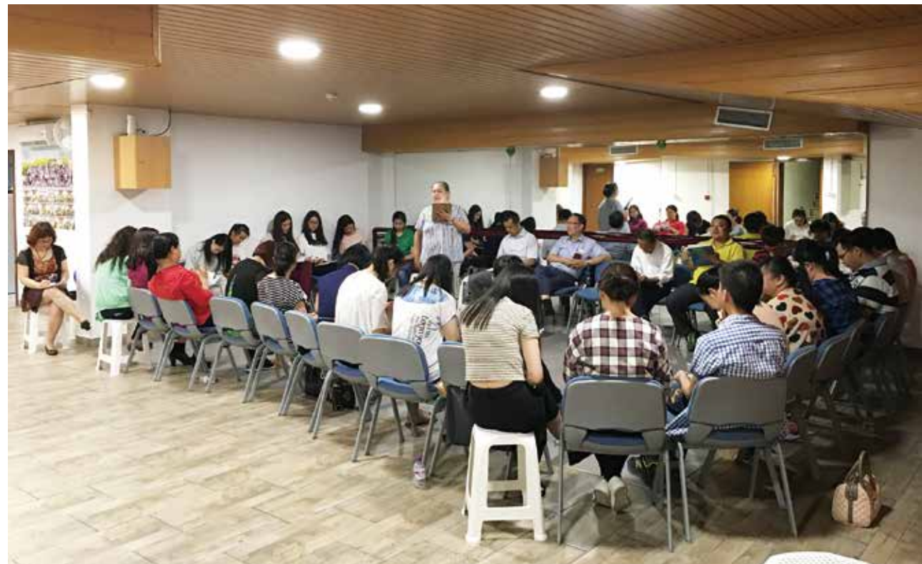
△ 荷兰陈李湘萍师母带领神学培训班讨论