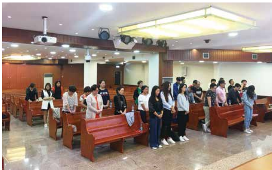
▽ 2018年10月11日祷告会合影