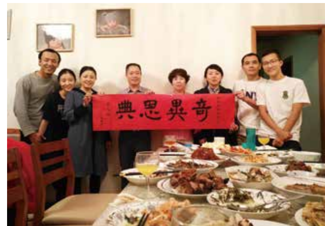
△ 在陈牧师家里宴请北方来的新移民