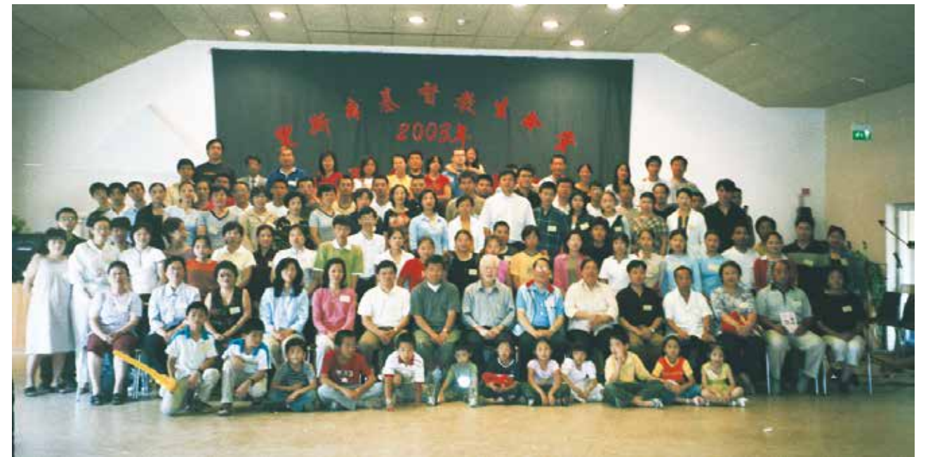
△ 2003年葡萄牙生命堂首届夏令营

今年是我们葡萄牙福音佈道会暨里斯本生命堂成立20周年的庆典，我们编辑出版此纪念册，为了是记录20年来弟兄姐妹的感动和见证，记录20年整个葡萄牙生命堂具有代表意义的活动照片，让我们以文字和照片的形式来纪念上帝在葡萄牙的作为，让当代的弟兄姐妹有个美好的回忆，更让下一代的弟兄姐妹借此文字和照片得到激励，接棒前人传福音的使命，为主大发热心，为主抢救灵魂，为主建立教会。