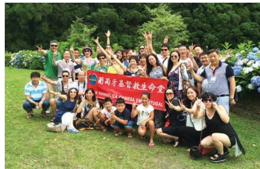
△ 2015年7月亚速尔音乐佈道会结束旅行