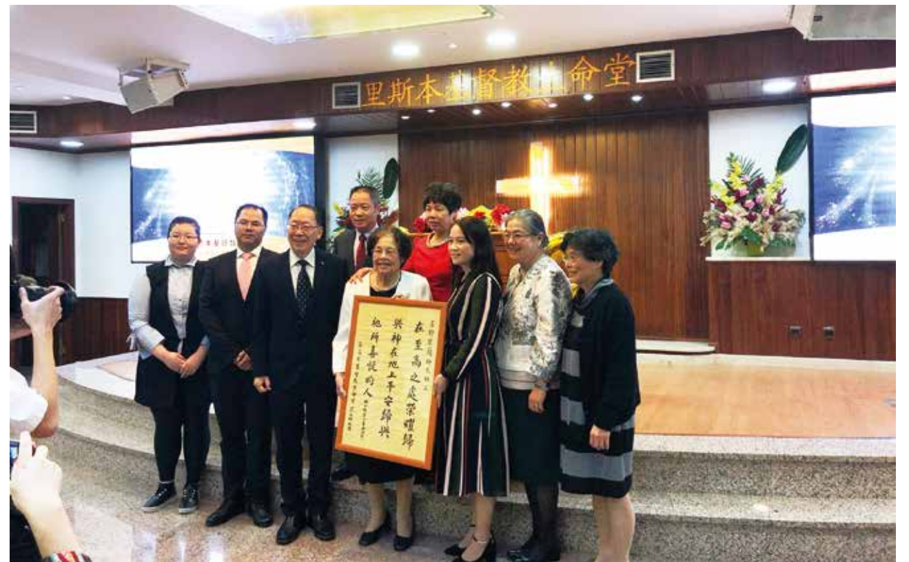
△ 里斯本19周年贈送書法金句給師太