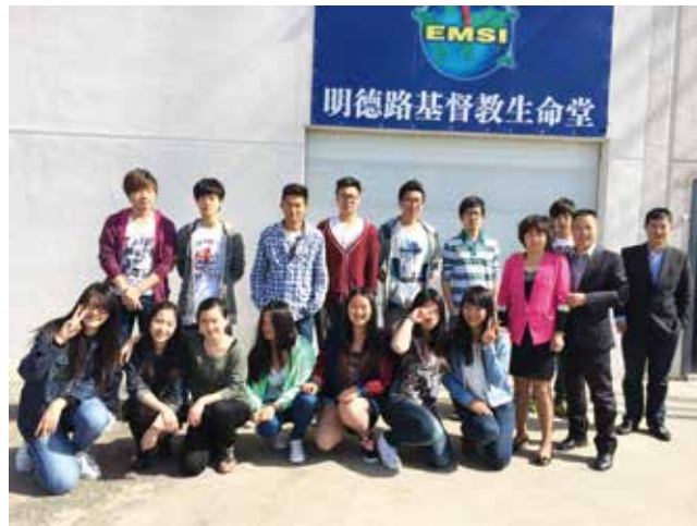
△ 明德路教堂門口合影