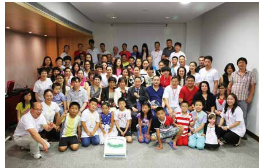
△ 2015年7月15日亚速尔音乐佈道会合影

感谢主,还有大家的爱心与奉献,在2016年这一年中,除了买下亚速尔生命堂的新会所,我们还买下了思督堡生命堂的新会所和波尔图生命堂的新会所,这能让我们更好地学习交流,让我们更好的投入主的怀抱。