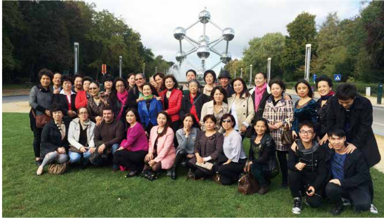
△ 比利时元子钟合影