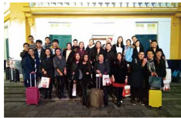
△ 完美完成亞述爾聖誕晚會集合到機場