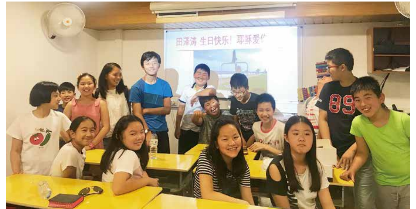
△ 里斯本主日學濤濤生日