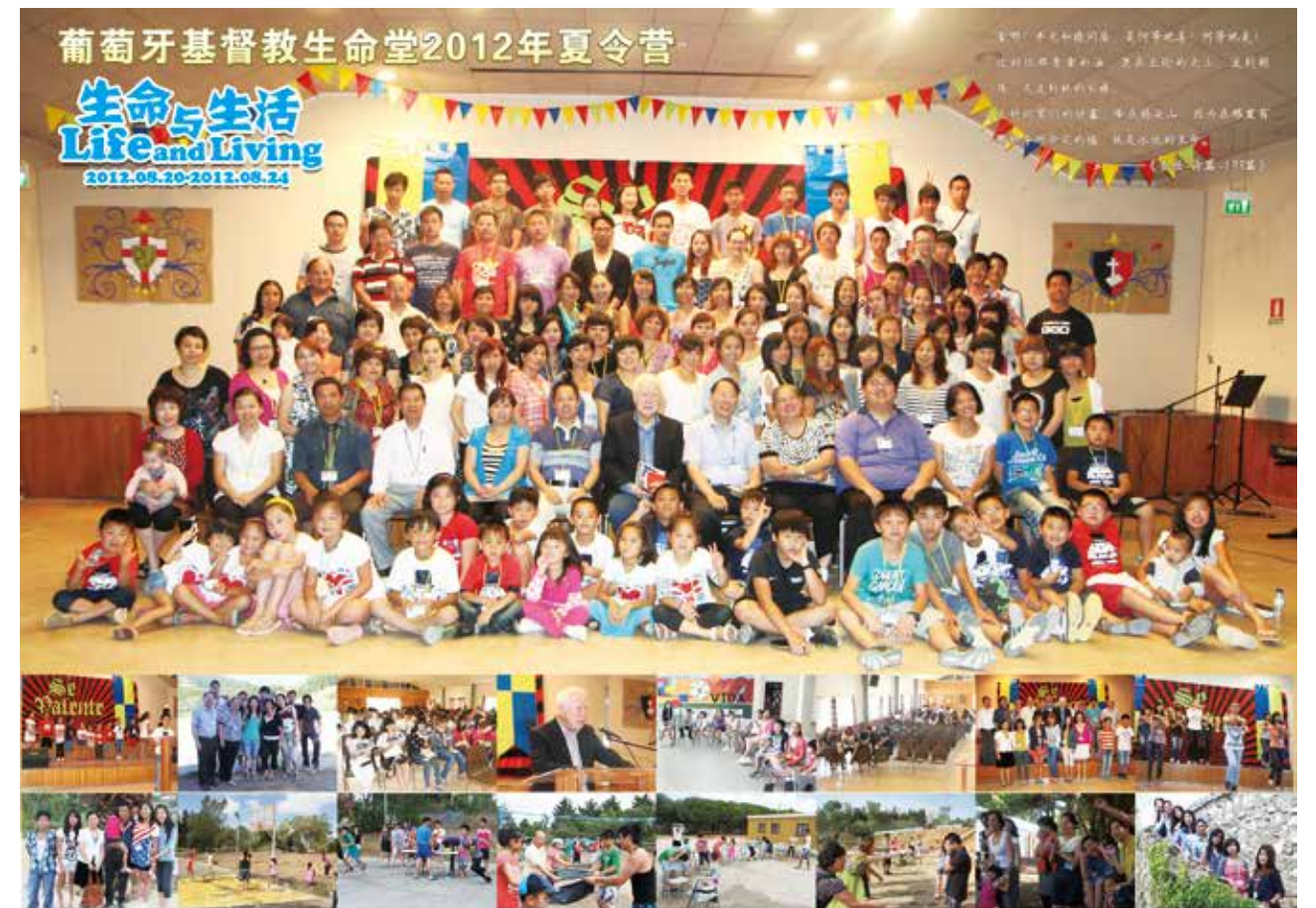
△ 2012年葡萄牙生命堂夏令营