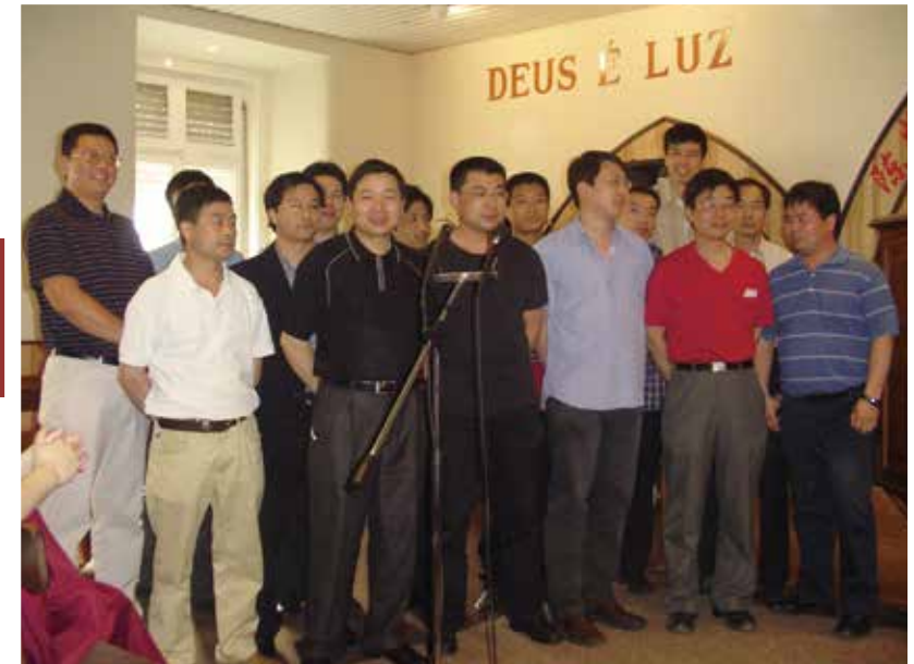
△ 2005年5月8日弟兄團契成立