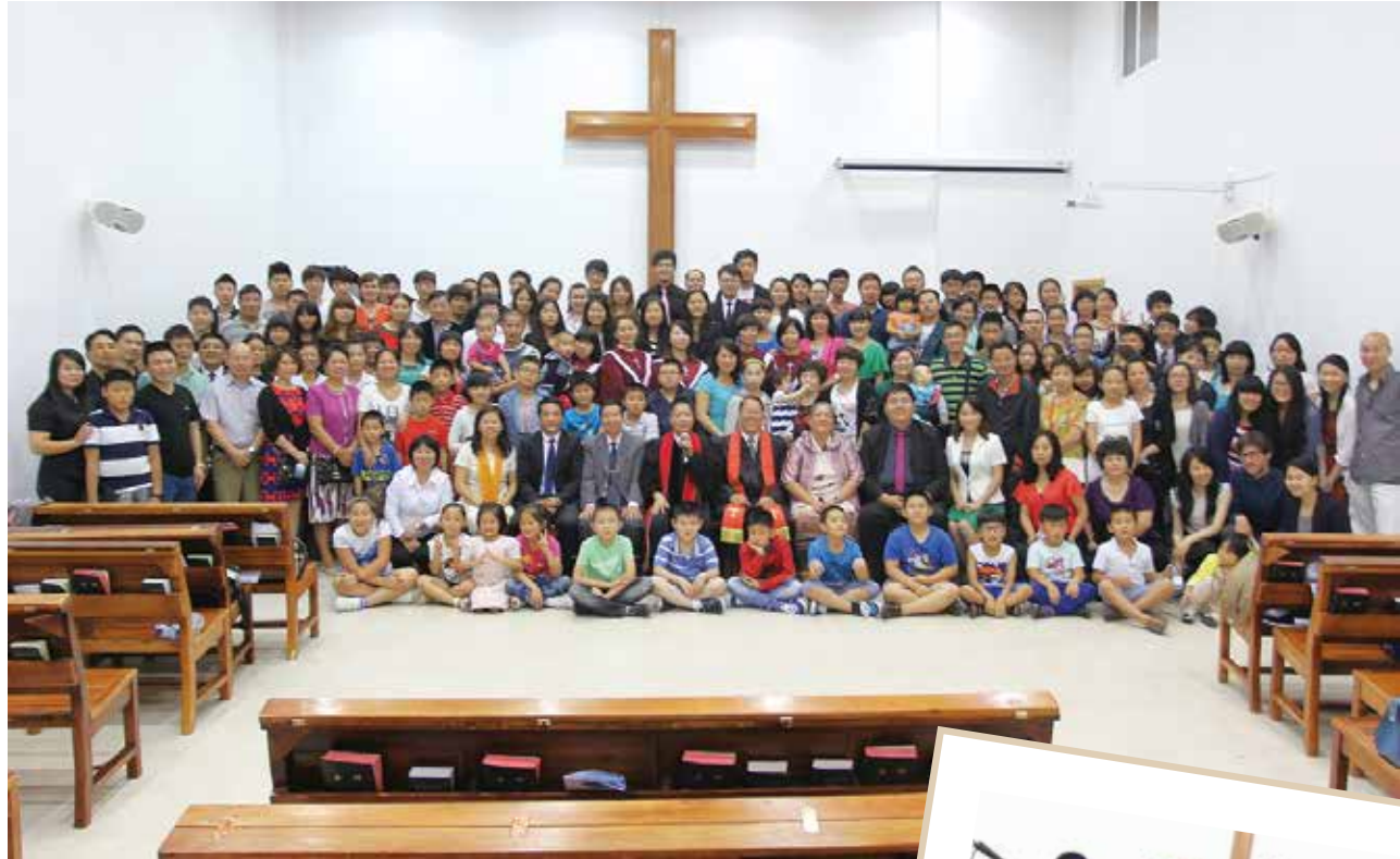
△ 2013年8月25号明德路生命堂落成典礼合照