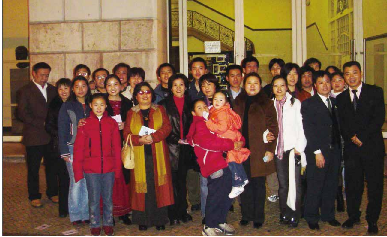
△ 借着华人春节晚会组织教会弟兄姐妹发福音单张