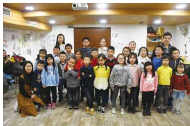
△ 2018年里斯本主日学约瑟班