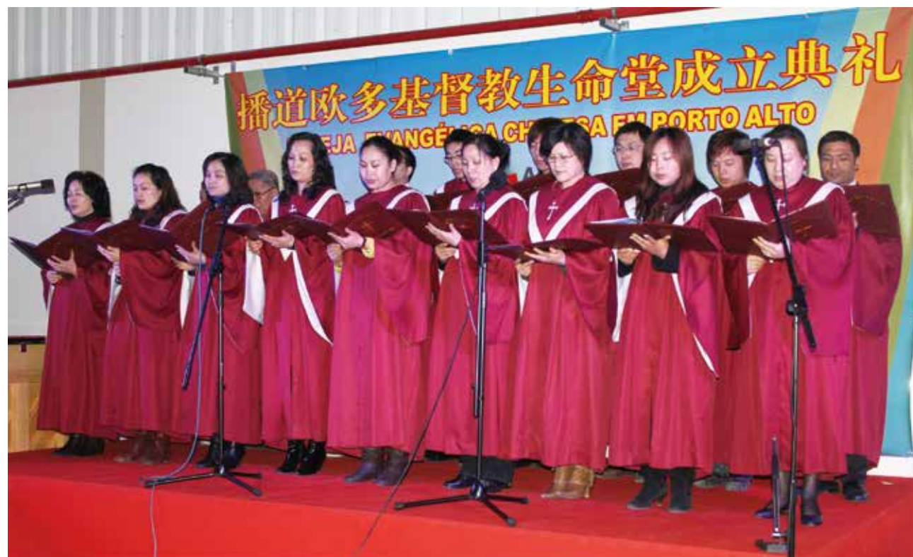
△ 2010年1月31日成立时诗班献诗