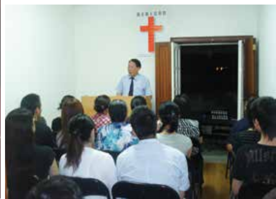
△ 2006年楊摩西牧師在波爾圖恩周年之際施洗