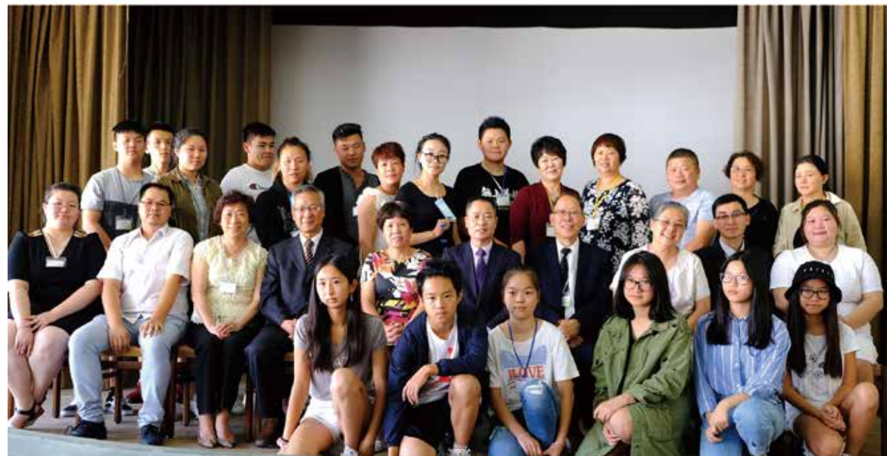
△ 2018年夏令营感动决志信主的弟兄姐妹与牧者合影