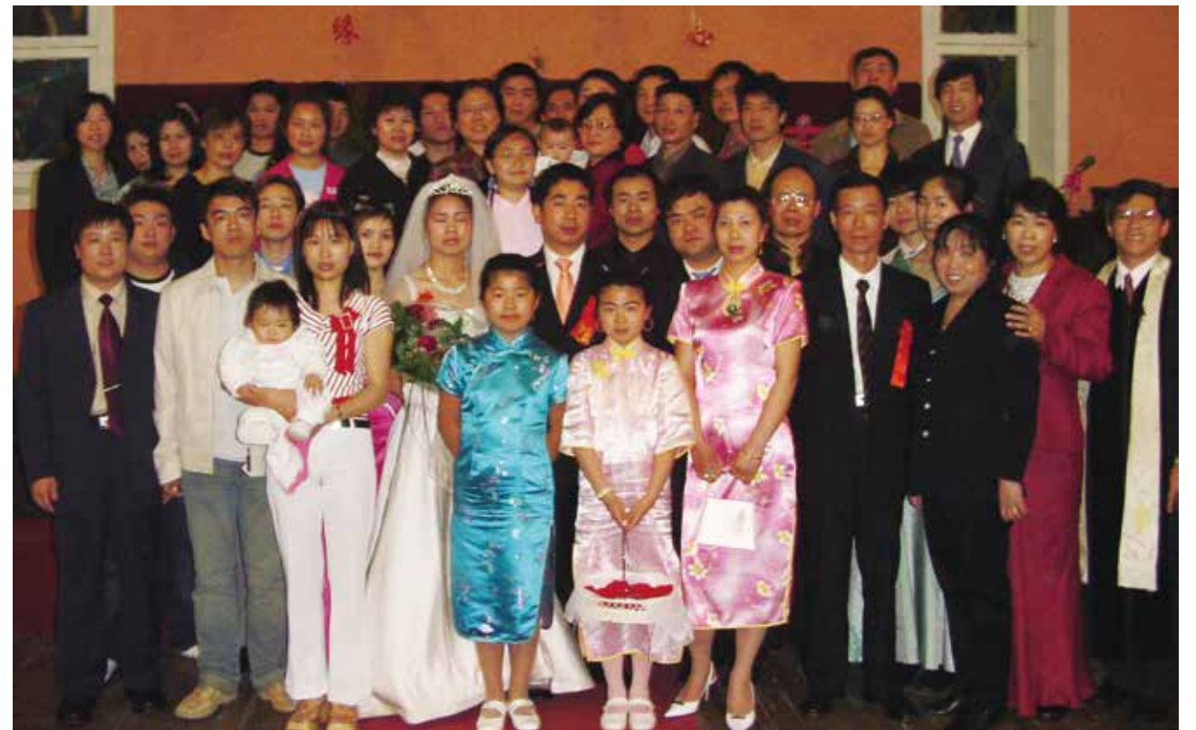
△ 2008年波爾圖生命堂第一對婚禮