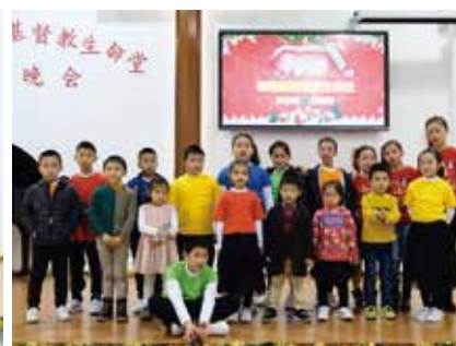
△ 2018年聖誕晚會主日學