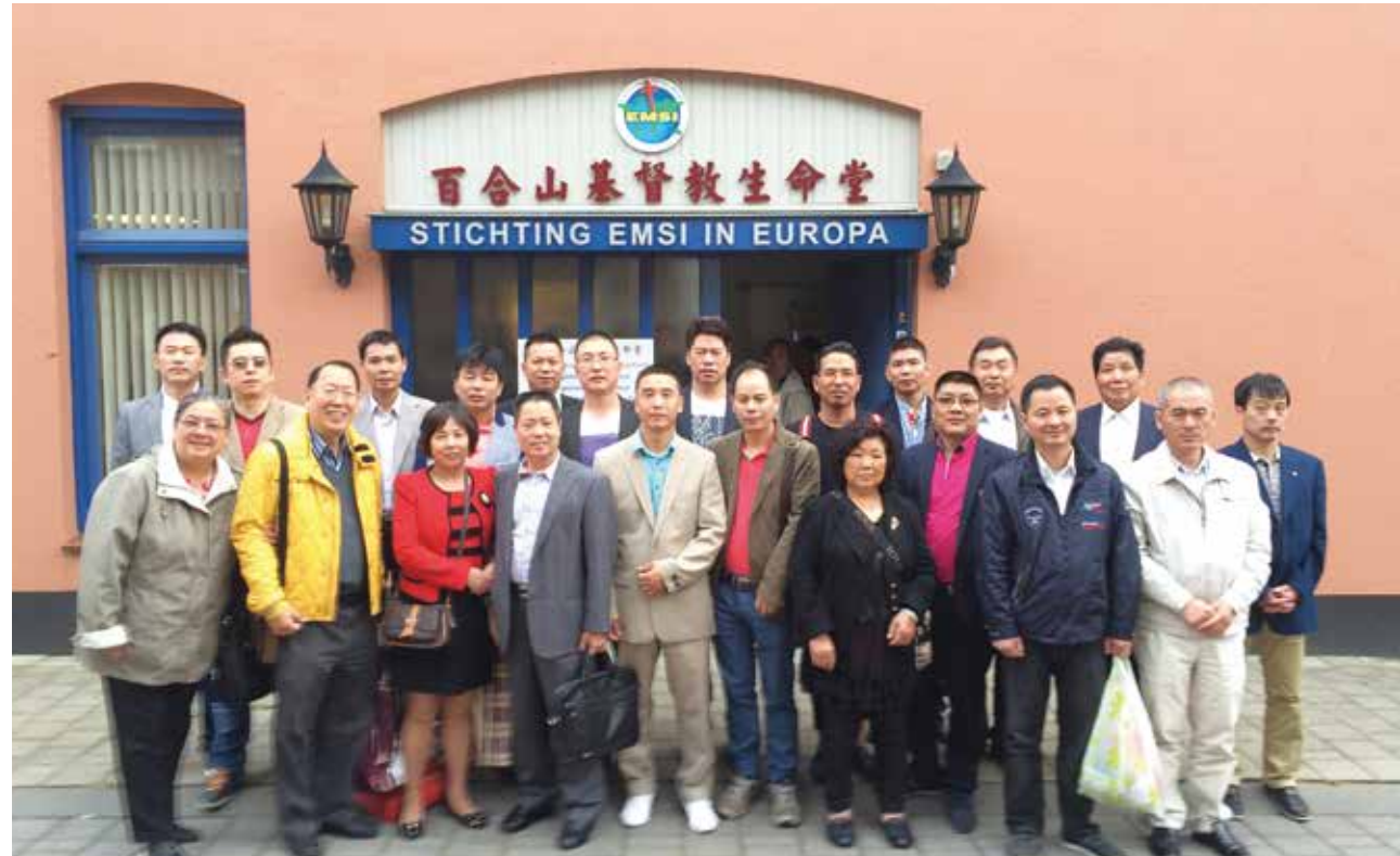
△ 荷兰百合山生命堂留念