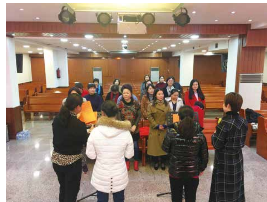
△ 2019年2月份姐妹团契愿为耶稣的缘故改变自己