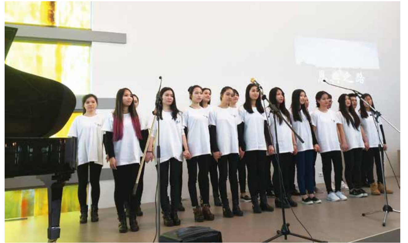
△ 葡萄牙青年团契在荷兰献诗