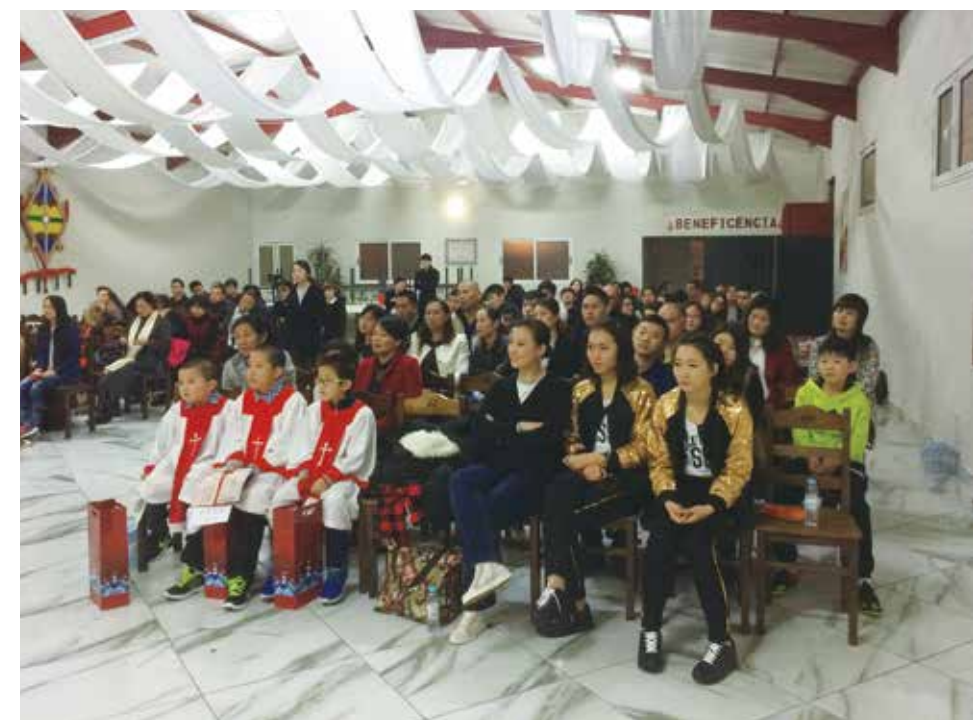
△ 2015年12月亞速爾聖誕晚會現場