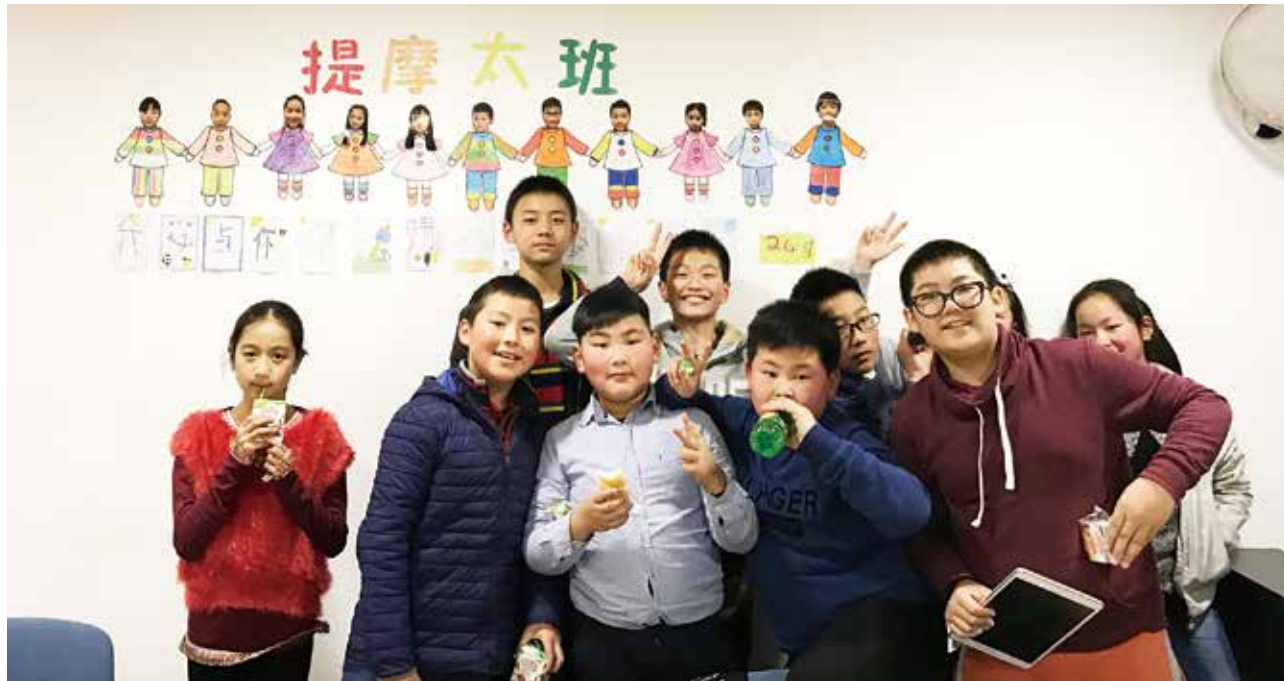
△ 里斯本主日學提摩太班