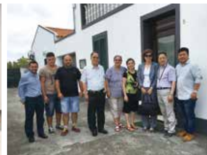
△ 亚速尔教堂签约后与律师及葡国友人在教堂门口合影