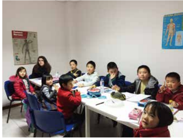
△ 2016年波尔图生命堂中文学堂