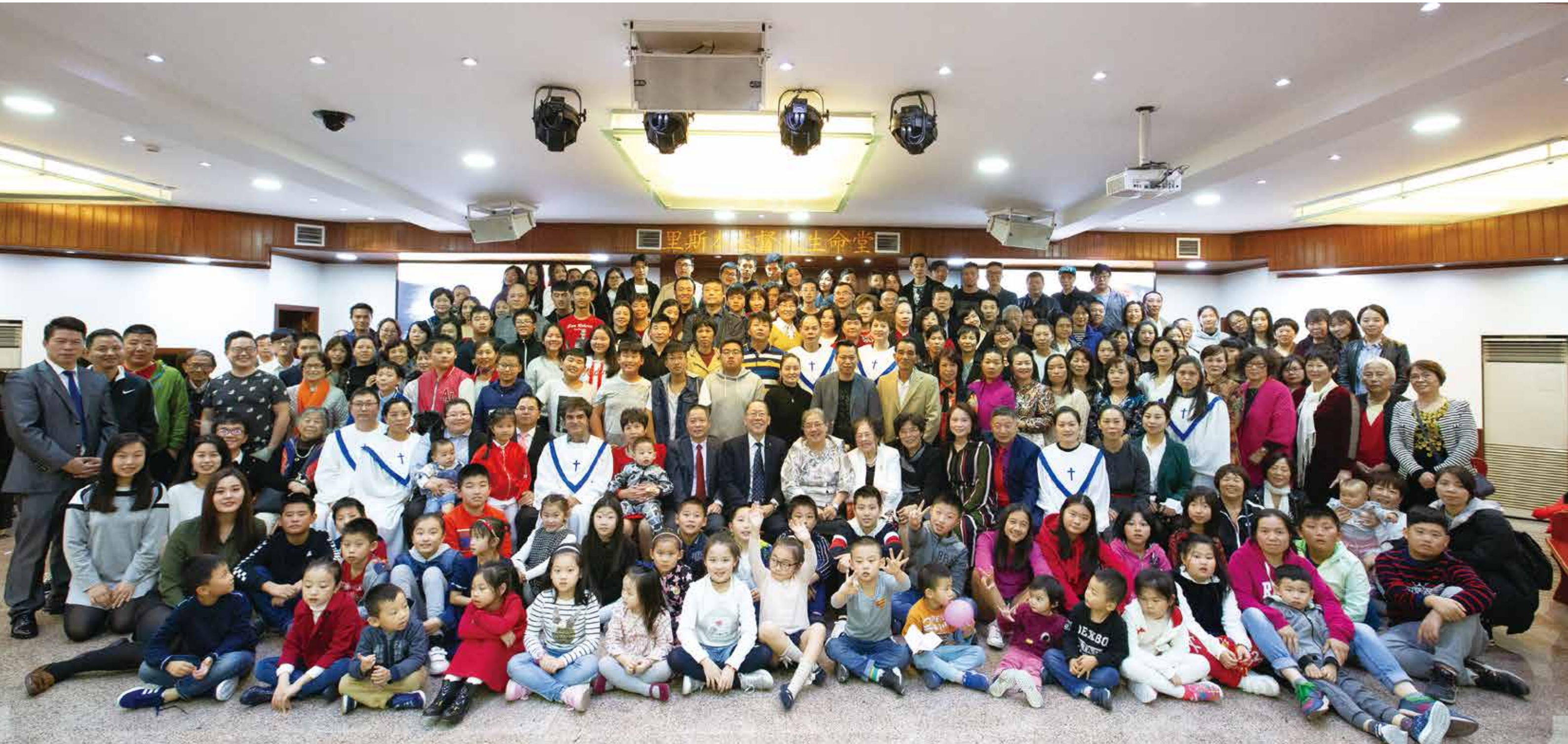
△ 里斯本19周年集体照