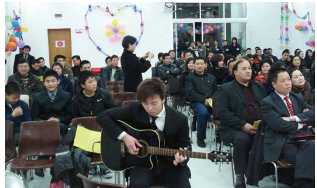
△ 2011年在原來租的地方慶祝耶穌降生