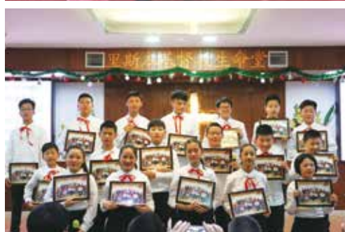
◁ 里斯本圣诞 晚会提摩 太班