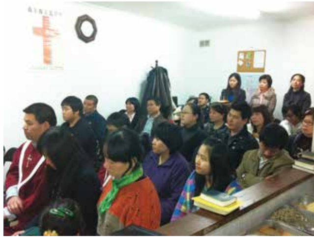
△ 2012年波尔图生命堂在RUA CHA