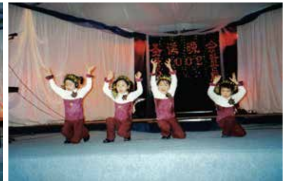
△ 2002年聖誕晚會主日學表演