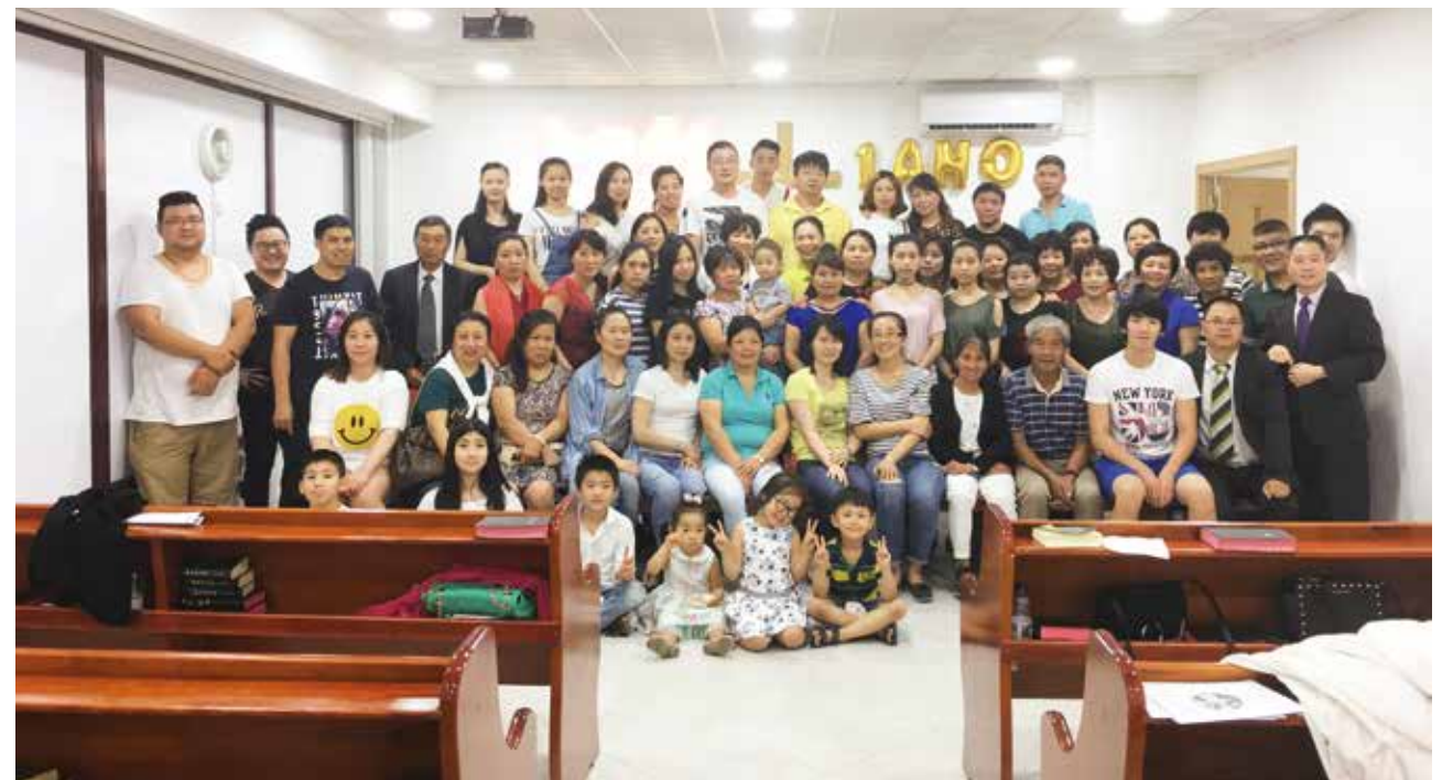
△ 思督堡一周年合影