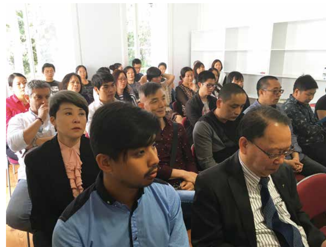
△ 2016年马德拉生命堂成立现场