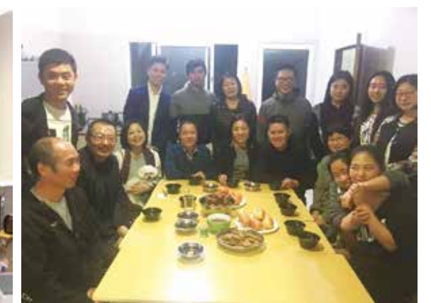
△ 聚会后享受姐妹们预备的晚餐