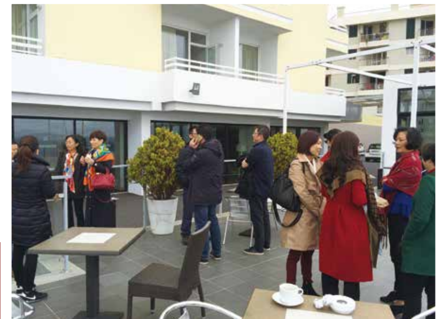
△ 2016年1月佈道会同工前往马德拉宣教