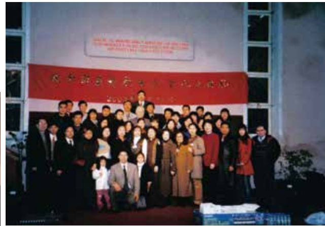
▽ 2002年1月21日波尔图生命堂成立典礼