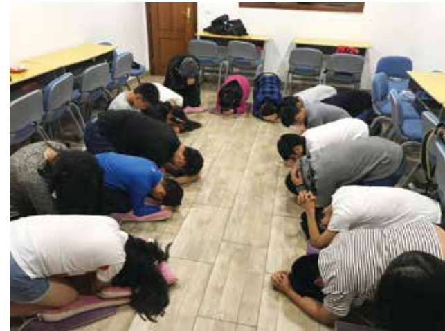
△ 里斯本主日学祷告会2018