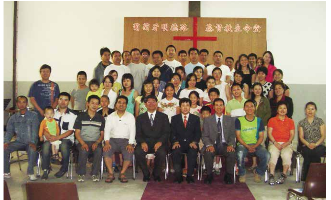
△ 2006年6月11日明德路生命堂成立合影

我们明德路教会每周聚会的会友大概30到40人左右（2012年），虽然在葡萄牙整体经济不景气的光景之下。通过几个月的信心锻炼，我们明德路同工们信心已经猛增，大家都觉得有信心购买，并且在上帝面前承若为建堂信心认献10万欧元，感谢上帝，在2012年12月5号到2013年1月30号不到两个月的时间里，我们收到258063欧元的建堂奉献款。其中明德路本堂的奉献超过了愿先承若奉献10万欧元的上限，感谢赞美主，真的了不起，他们也已经尽力了，其他的奉献是来自里斯本生命堂和荷兰生命堂等其兄弟堂会的奉献支持，在神的带领和弟兄姐妹大力的支持下，明德路生命堂的新堂于2013年8月25日落成典礼奉献给神，哈利路亚。