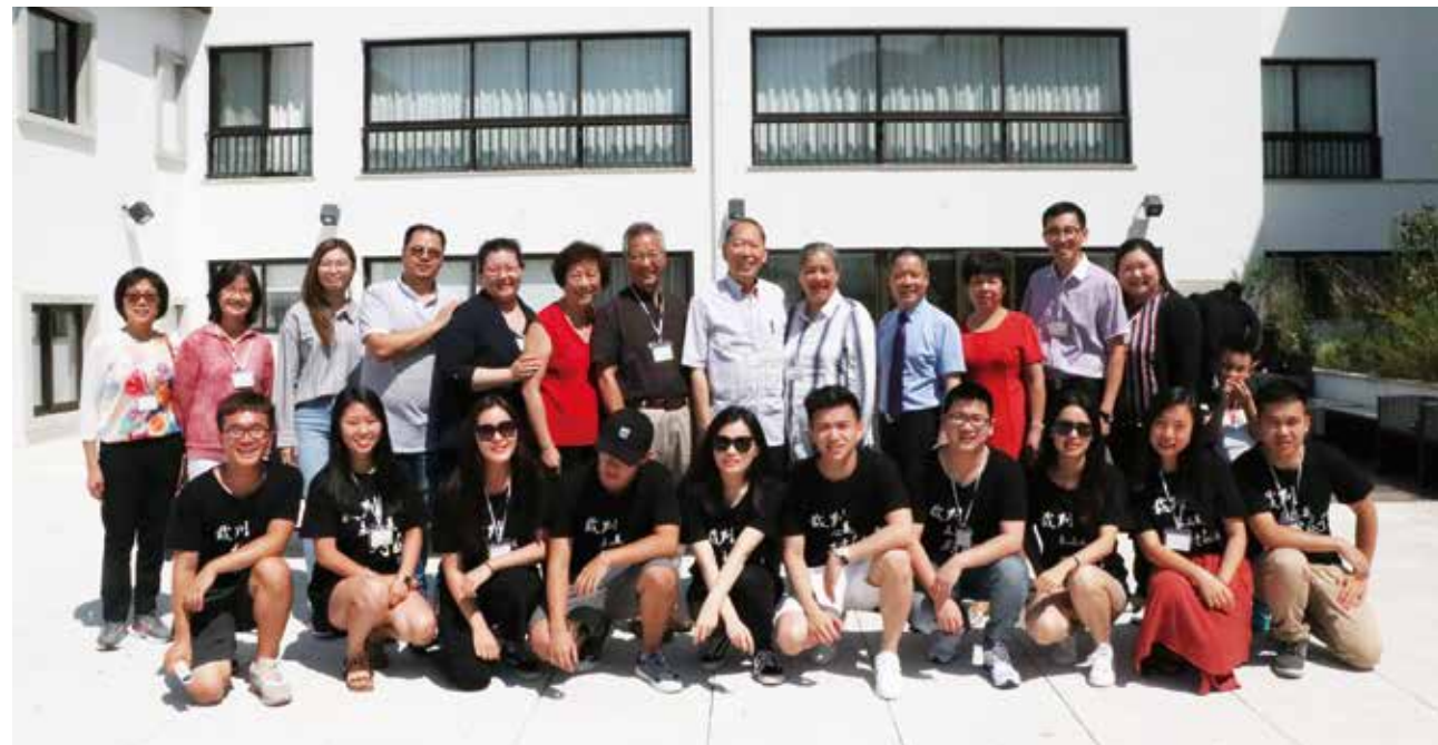
△ 2018年夏令营牧者与事奉人员合影