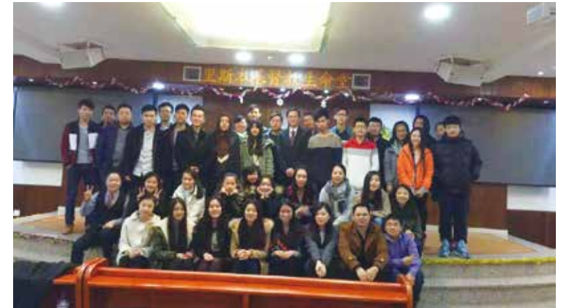
△ 2015年钱弟兄与里斯本青年团契