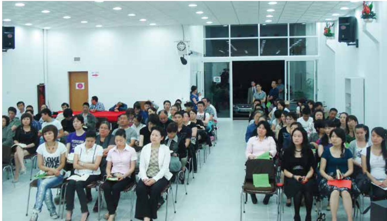
△ 2010年明德路4周年會場