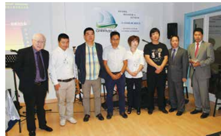
△ 2015年8月22日亞速爾生命堂成立當天受洗