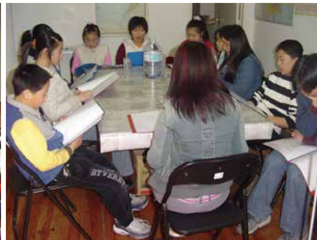
△ 2004年1月25日青少年團契成立