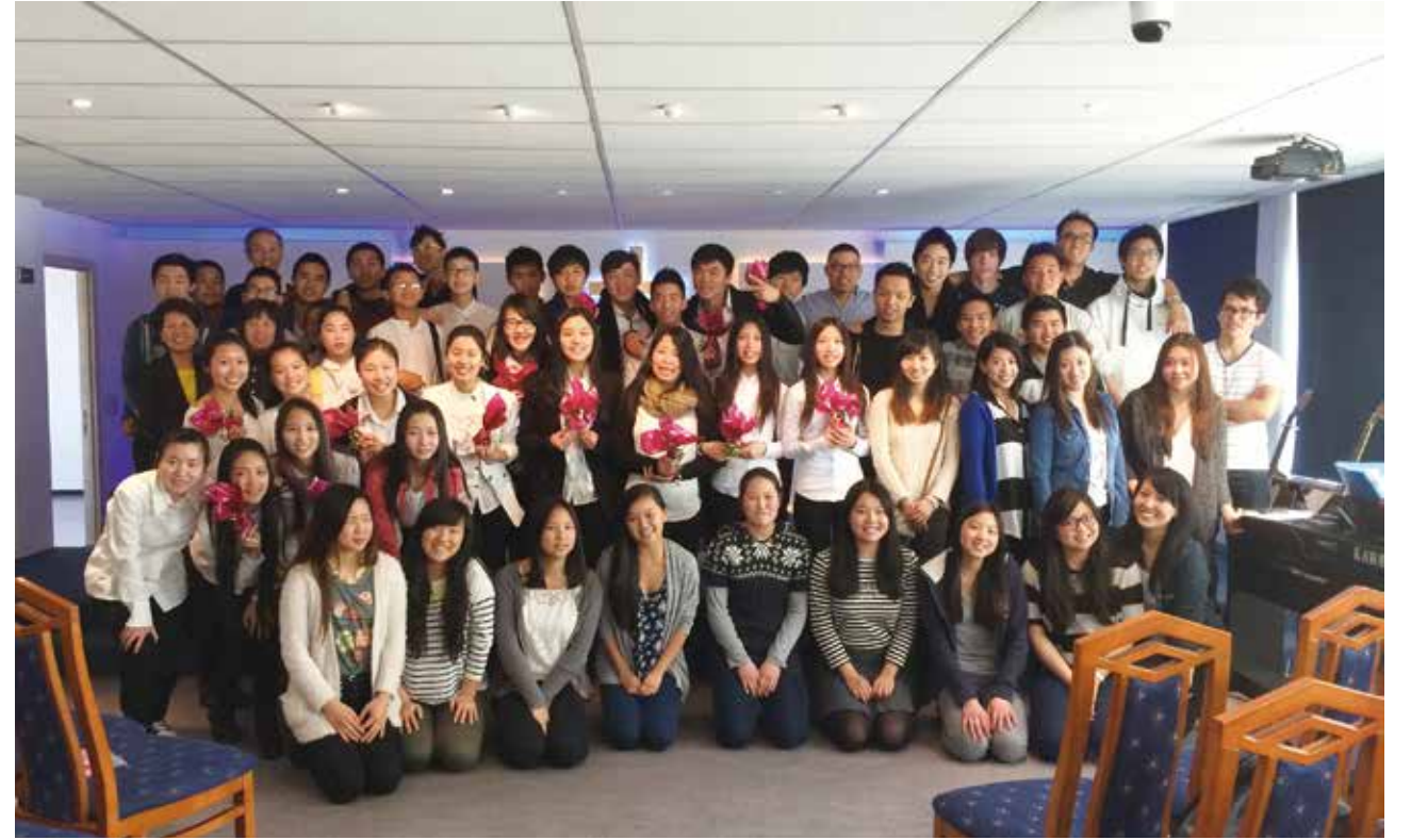
△ 葡萄牙青少年与比利时生命堂青少年联谊