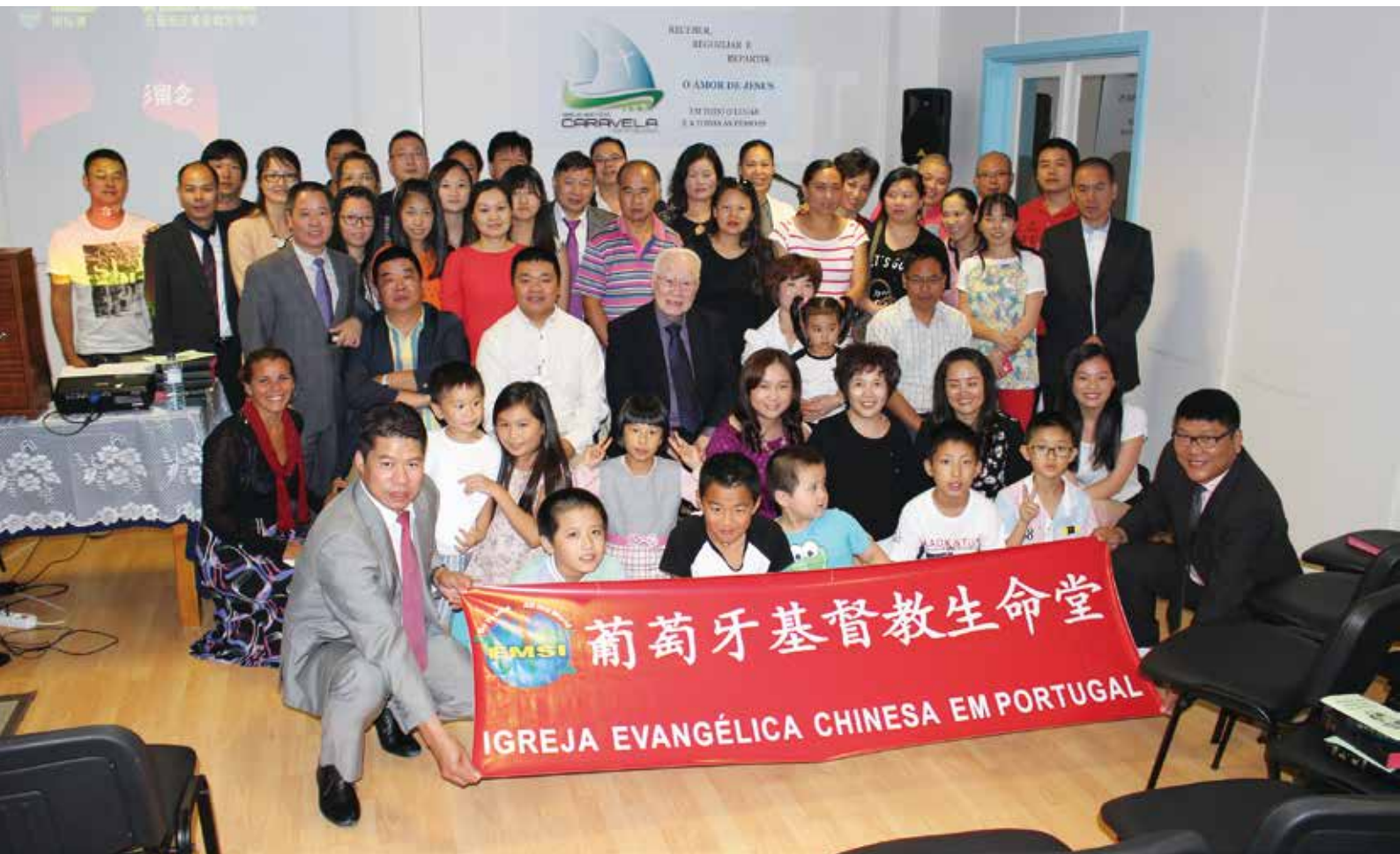
▽ 2015年8月22日亞速爾生命堂成立合影