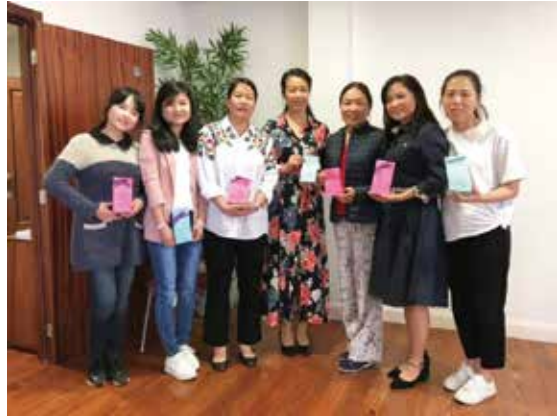
▽ 2017年马德拉生命堂姐妹们