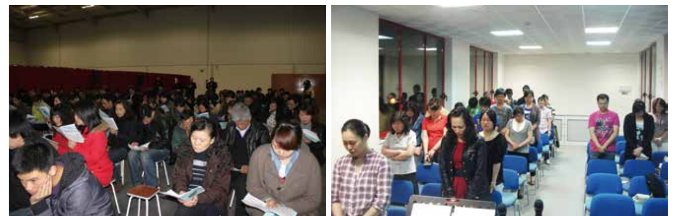
△ 2010年1月31日播道欧多基督教生命堂成立时的场景