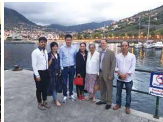
△ 马德拉生命堂部分兄弟姐妹与牧师合影