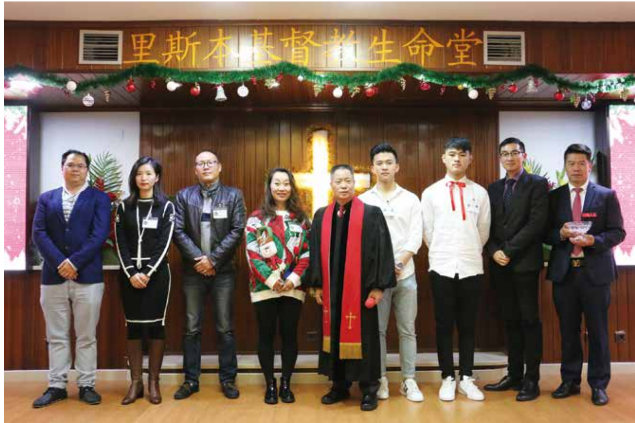
△ 里斯本圣诞节受洗