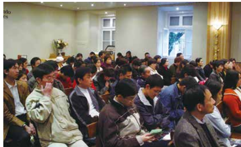
△ 2004年在RATO教堂舉行聖誕晚會